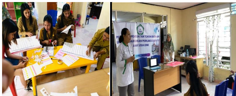
Gambar 1. Pelatihan Media Token Economy

Pelatihan pembuatan media Token Economy bagi guru PAUD di Kota Ternate khususnya pada PAUD Charis ini sangat penting dan bermanfaat karena memberikan pemahaman serta keterampilan terkait dengan pembuatan media berupa Token Economy yang dapat mengembangkan kemampuan anak dalam mengendalikan diri untuk termotivasi dalam melakukan perbuatan yang tidak mengganggu teman dikelas. Dengan pelatihan ini, guru dapat berkreasi membuat berbagai media token economy dengan berbagai tujuan seperti menurunkan perilaku disruptif, membuat anak termotivasi dalam memenuhi tujuan pembelajaran. Berikut dokumentasi kegiatan pelatihan yang dilakukan di PAUD Charis Kota Ternate: