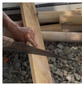
b. Pemotongan kayu untuk alas kolam