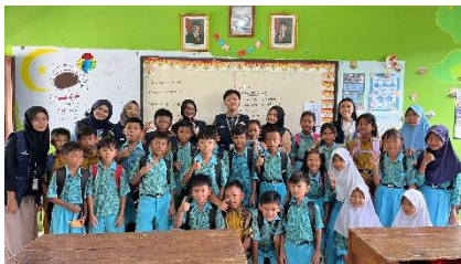
a. Kelompok belajar

Strategi pemecahan masalah bidang pendidikan yaitu menginisiasi program kelompok belajar di sekitar posko yang dikemas dengan permainan menarik dan melaksanakan program kunjungan TPQ. Dengan adanya bimbingan belajar dapat membangkitkan minat bakat anak terhadap pembelajaran dengan memberikan pengalaman belajar menyenangkan dan menarik serta meningkatkan kemampuan anak dalam mengerjakan tugas (7.a). Bimbingan belajar ini dilaksanakan di posko sebanyak dua kali dalam satu minggu dengan sasaran anak-anak yang rumahnya berada di lingkungan posko KKN. Selain itu juga dilakukan pendampingan TPQ untuk membantu anak-anak dalam mengembangkan pengetahuan agama, keterampilan membaca Al Qur'an serta membantu tenaga pendidik yang ada di TPQ (7.b). Kegiatan lain yang mendapat antusias tinggi oleh anak-anak adalah pendampingan pendidikan jasmani untuk siswa SDN 1 Pekuncen (7.c).