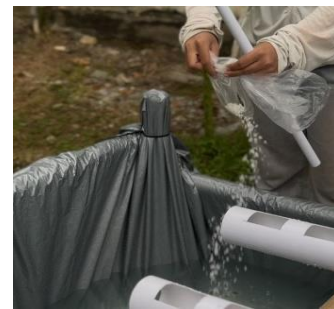
c. Penuangan garam ikan