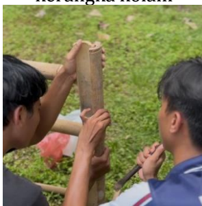
d. Pemasangan kerangka kolam