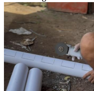
f. Pelubangan paralon untuk media tanam