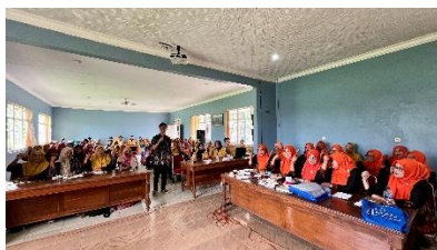
a. Sosialisasi digital marketing

Ketiga, untuk mengatasi peredaran rokok ilegal, akan dilakukan sosialisasi mengenai bahaya rokok ilegal (6.c). Selain itu, pemetaan ( mapping ) peredaran rokok ilegal di Desa Pekuncen akan dilakukan untuk mengetahui titik-titik rawan sehingga dapat dirancang strategi pengendalian yang efektif. Berdasarkan survei kepada para pedagang kelontong di desa, tidak ditemukan adanya penjualan rokok ilegal. Namun, masyarakat perlu mendapatkan sosialisasi mengenai gempuran rokok ilegal. Sosialisasi ini berfokus pada edukasi masyarakat mengenai dampak negative dan bahaya ekonomi sosial yang ditimbulkan oleh rokok ilegal. Sosialisasi ini juga membahas cara mengenali produk rokok ilegal dan mendorong masyarakat untuk berperan aktif dalam pencegahannya. Keempat, sosialisasi literasi keuangan akan digelar untuk meningkatkan pemahaman masyarakat terhadap sistem pembayaran modern dan pengelolaan keuangan. Masyarakat akan diajarkan cara menggunakan QRIS untuk mempermudah transaksi nontunai. Selain itu, mereka juga akan diberi edukasi mengenai bahaya pinjaman online ilegal dan cara mengenali serta menghindarinya. Kegiatan ini bertujuan untuk memberikan edukasi kepada masyarakat dan pelaku UMKM terkait penggunaan QRIS sebagai metode pembayaran digital yang aman dan praktis. Selain itu, sosialisasi ini juga mengingatkan masyarakat tentang bahaya pinjaman online ilegal yang sering menjerat konsumen.