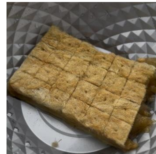
f. Pembasahan media tanam