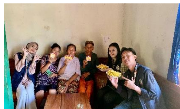
b. Pendampingan UMKM