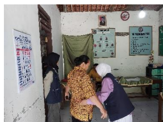
b. Pendampingan posyandu remaja dan lansia