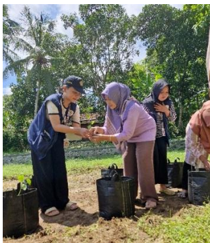
a. Intensifikasi pekarangan

Strategi yang dilakukan untuk mengatasi permasalahan lingkungan yang sedang dialami di Desa Pekuncen adalah penerapan intensifikasi perkarangan dengan penanaman cabai menggunakan planter bag , kegiatan penyuluhan dan pembuatan home decomposer , serta kegiatan program kerja pertanian terpadu kolam dan sayuran di Desa Pekuncen. Sasaran kontribusi sosial bidang lingkungan di Desa Pekuncen adalah Kelompok Wanita Tani (KWT) dan anggota PKK desa. Pada 11 Januari 2025 dilaksanakan berbagai kegiatan antara lain intensifikasi perkarangan melalui penanaman bibit cabai dengan planter bag . Kegiatan ini dilakukan pada minggu pertama KKN (Husni Fauzi et al., 2023). Tujuan dari kegiatan ini adalah untuk memanfaatkan pekarangan secara optimal dengan budidaya tanaman cabai dalam planter bag sebanyak 20 buah. Kegiatan lainnya yaitu penyuluhan dan pembuatan home decomposer . Kegiatan ini dilakukan pada minggu kedua dilakukannya KKN. Tujuan dari kegiatan ini supaya masyarakat paham tentang pengolahan limbah rumah tangga organik yang diolah menjadi decomposer yang nantinya dapat dimanfaatkan sebagai pupuk tanaman. Setelah kegiatan penyuluhan dilanjutkan dengan praktik pembuatan home decomposer (1.b, 1.c) berikut ini dengan menggunakan EM4 untuk mempercepat pembusukan.