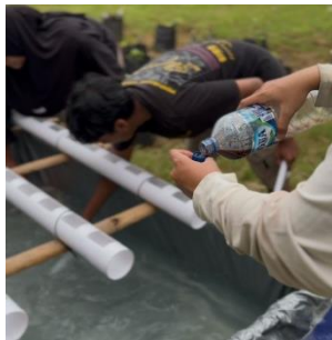
d. Pemberian EM4