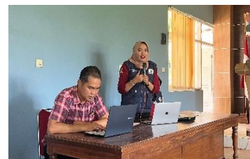
c. Pelatihan penulisan berita