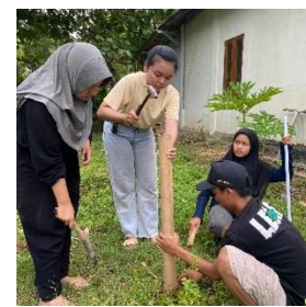
c. Pemasangan patok untuk kerangka kolam