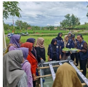
i. Sosialisasi ke KWT