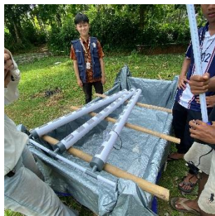
a. Pemasangan instalasi kolam

Tahap selanjutnya yaitu pemasangan instalasi kolam, pertama mempersiapkan paralon untuk bak tanam beserta pompa air dipasang pada kolam (4.a). Kemudian, kolam diisi dengan air hingga ketinggiannya mencapai 60 cm (4.b). Selanjutnya, sebanyak 300 gr garam ikan ditaburkan pada kolam yang telah diisi air untuk menstabilkan pH air (4.c) dan pemberian EM4 dengan mempersiapkan 5 botol EM4 dituang ke dalam air kolam untuk menjaga mikroorganisme baik di dalam kolam (4.d). Selanjutnya, air kolam diaduk hingga garam ikan dan EM4 yang sudah dimasukkan ke tercampur merata (4.e). Setelah instalasi kolam selesai, tahap berikutnya adalah mempersiapkan media tanam berupa rockwool dibasahi dengan cara direndam air di dalam baskom (4.f). Media tanam yang telah dibasahi dilubangi sebagai tempat tumbuhnya tanaman selada (4.g). Kemudian, tanah yang terdapat pada akar bibit selada dibersihkan terlebih dahulu sebelum bibit selada dipindah tanam ke gelas plastik berisi rockwool (4.h). Tahap terakhir adalah memasukkan bibit selada ke lubang instalasi paralon (4.i)