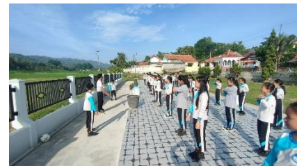
c. Pendampingan Penjas