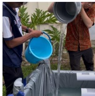
b. Penuangan air pada kolam