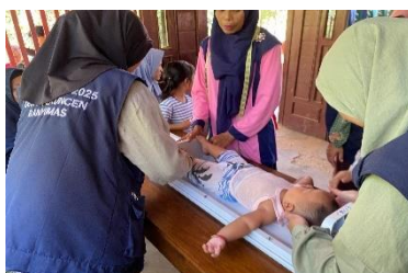
a. Pendampingan posyandu balita

Strategi pemecahan masalah bidang kesehatan yaitu mengedukasi tentang pola makan sehat kepada ibu balita melalui kegiatan ILP Posyandu (7.a). Selain itu, untuk meningkatkan kesadaran screening kesehatan, dilakukan melalui kunjungan rumah oleh kader Posyandu, pengumuman melalui pertemuan desa, serta pemberian insentif sederhana bagi warga yang berpartisipasi. Program kerja pendampingan posyandu balita dan batita seperti membantu kader dalam melaksanakan pemeriksaan di posyandu, sedangkan untuk para remaja sosialisasi mengenai penyakit anemia dan pentingnya minum tablet penambah darah (7.b dan 7.c). Kemudian, pada bidang kesehatan dilakukan sosialisasi stunting dan wasting mengenai ketahanan pangan dan gizi yang akan relevan dengan stunting dan obesitas pada anak. Selanjutnya, edukasi mengenai perilaku hidup bersih dan sehat dengan materi PHBS dan demo cuci tangan pakai sabun di SD Pekuncen (7.d).