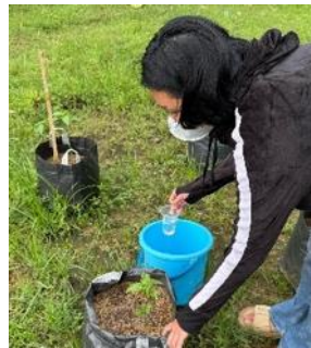
b. Perawatan tanaman