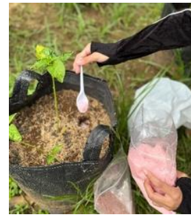
c. Pemupukan dan penyemprotan pestisida