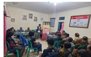
c. Sosialisasi gempuran rokok ilegal