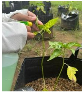
a. Pemberian nutrisi tanaman