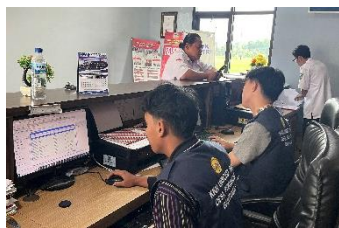
a. Piket desa