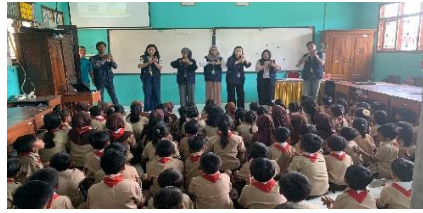
d. Sosialisasi PHBS