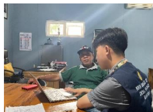
b. Pengembangan website