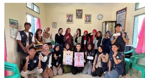
c. Sosialisasi cegah anemia pada remaja