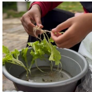
h. Pemisahan selada dari tanah