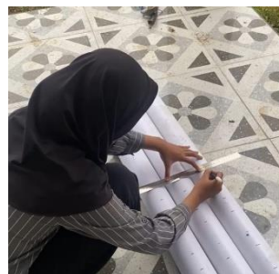
e. Pembuatan garis untuk jarak tanam