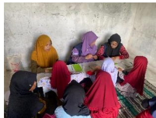
b. Pendampingan TPQ