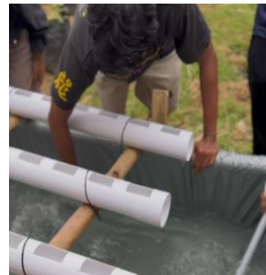
e. Pengadukan air kolam