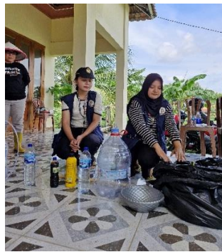
b. Penyuluhan home decomposer