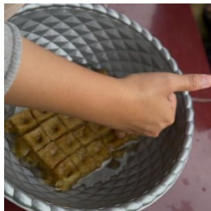
g. Pelubangan media tanam