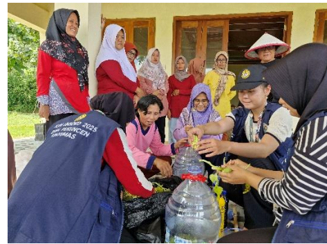
c. Pembuatan home decomposer