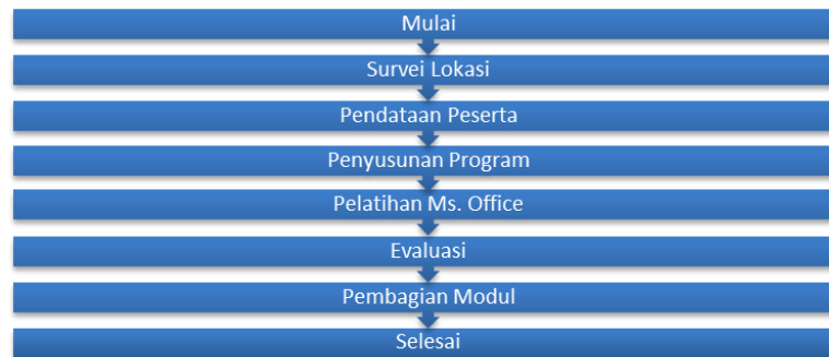
Gambar 1. Tahapan Kegiatan Pelatihan

Berikut penjelasan mengenai Gambar 1 tahapan kegiatan pelatihan di atas sebagai berikut: