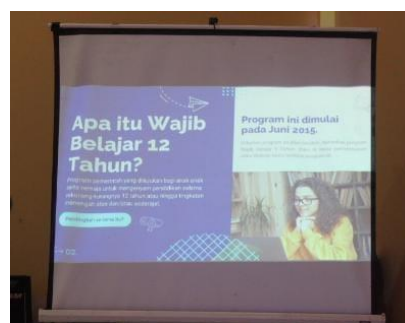
Gambar 3. Materi sosialisasi pentingnya Pendidikan 12 tahun

Tujuan dari program wajib belajar 12 tahun ini adalah untuk mempersiapkan generasi penerus yang berkualitas dan unggul dengan mewajibkan mereka minimal menyelesaikan Sekolah Menengah Atas (SMA) (Iis Margiyanti dan Siti Tiara Maulia, 2023). Namun kenyataannya, aplikasi ini masih belum beroperasi secara maksimal dalam kehidupan masyarakat pada masa sekarang ini. Hal ini sesuai dengan hasil yang telah didapatkan, khususnya dari data SDN Girimulyo yang menunjukkan bahwa sebagian besar lulusan SD sudah lulus semua dan melanjutkan pendidikan ke SMP sederajat dan ada yang meneruskan ke pondok pesantren. Di sisi lain, program wajib belajar 12 tahun di Desa Girimulyo belum terlaksana dengan baik. Dalam pelaksanaan wajib belajar 12 tahun masih ditemukan banyak anak yang belum dapat menyelesaikan pendidikannya sampai ke tingkat SMA.