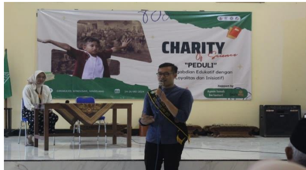
Gambar 2. Sosialisasi pentingnya pendidikan 12 tahun

Girimulyo dan program 12 tahun tidak dapat dipisahkan setelah dilaksanakan. Program pendidikan wajib belajar oleh pemerintah pusat dan daerah berupaya meningkatkan kualitas sumber daya manusia di Indonesia dengan memperluas akses terhadap pendidikan yang sesuai dengan kebutuhan masyarakat. Program wajib belajar 12 tahun yang telah direncanakan pemerintah untuk seluruh warga negara Indonesia membawa berbagai dampak dan manfaat yang signifikan (Suryadi, 2021). Melalui program ini, diharapkan generasi muda dapat memperoleh kesempatan yang lebih besar untuk mengenyam pendidikan hingga tingkat menengah atas, yang pada akhirnya akan meningkatkan daya saing nasional di era globalisasi (Wahyuni, 2020).