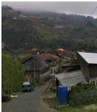
Gambar 5. Infrastruktur jalan Desa Girimulyo

Pada Desa Girimulyo akses jalan yang susah dan terletak di lereng Gunung Sumbing membuat infrastruktur dan sekolah SMP dan SMA belum merata dan pada desa tersebut belum tersedia karena akses kesana yang sulit.