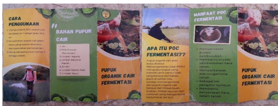
Gambar 3. Gambar Brosur Pembuatan Pupuk Organik Cair

POC yang telah dibuat dan difermentasi selama 2 minggu kemudian dikemas dalam botol plastik berukuran 1,5 L dengan tujuan memudahkan pengaplikasian POC pada tanah. Kemudian botol plastik dilabeli dengan stiker untuk menarik minat masyarakat. Selain itu, peserta juga melakukan sosialisasi dan memberikan POC yang telah dikemas kepada beberapa warga Desa Musir Lor. Sosialisasi ini bertujuan memberikan pengetahuan tentang manfaat POC dan mendorong masyarakat untuk membuka unit usaha baru pupuk organik skala rumah tangga yang dikelola warga. Unit usaha ini juga diharapkan dapat memenuhi kebutuhan petani lokal dan meningkatkan perekonomian di desa mereka (Wardana et al., 2024).