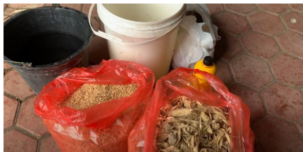
Gambar 1. Alat dan Bahan Pembuatan Pupuk Organik Cair

Pelaksanaan kegiatan pembuatan POC ini diikuti oleh 9 peserta kelompok 3 Kuliah Kerja Nyata Tematik (KKN-T) Merdeka Belajar Kampus Merdeka (MBKM) dari UPN "Veteran" Jatim. Tujuan dari pelaksanaan kegiatan ini adalah memanfaatkan limbah pertanian menjadi produk bernilai ekonomi salah satunya adalah POC. Kegiatan ini didukung oleh masyarakat setempat dengan menyediakan bahan percobaan pembuatan pupuk cair. Selain itu, program ini juga mendapatkan respon positif dari masyarakat. Sehingga masyarakat Desa Musir Lor pun saling membantu dalam mensukseskan program ini, yaitu dengan menyediakan bahan-bahan untuk pembuatan pupuk cair organik.