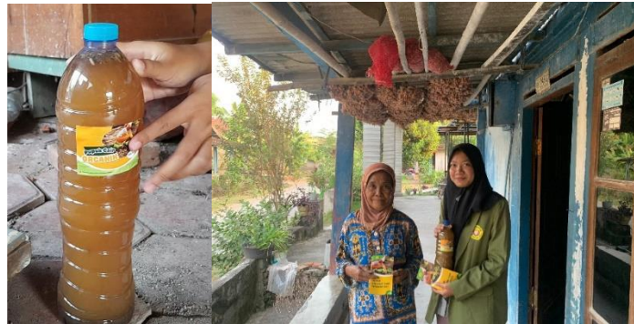
Gambar 2. Sosialisasi dan Pemberian POC

Kunci keberhasilan dari proses pembuatan POC terletak pada bioaktivator yaitu EM-4, dimana EM-4 ( Effective Microorganism 4 ) merupakan salah satu cairan dengan mikroorganisme yang memiliki manfaat yaitu mempercepat proses dekomposisi, meningkatkan mikroorganisme tanah dan meningkatkan kualitas tanah. Jumlah waktu yang diperlukan bakteri untuk mendekomposisi sampah organik mempengaruhi ketersediaan unsur hara dalam pupuk (Simanullang et al., 2024). Effective Microorganism 4 mengandung bakteri pengurai seperti Lactobacillus Sp , bakteri asam laktat, bakteri fotosintetik, Streptomyces , jamur pengurai selulosa dan bakteri pelarut fosfor yang secara alami mengurai zat organik (Suhastyo, 2020). Adapun ciri-ciri POC yang berhasil dibuat yaitu mengeluarkan aroma khas fermentasi seperti bau tape dan tidak ada belatung dan ulat di dalam POC.