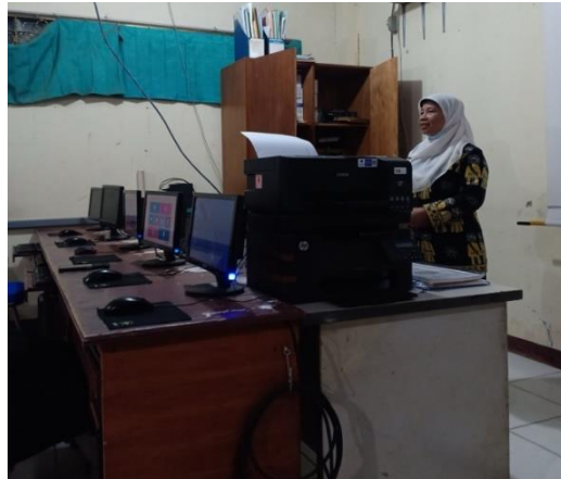
Gambar 2. Penjelasan Akuntansi Dasar