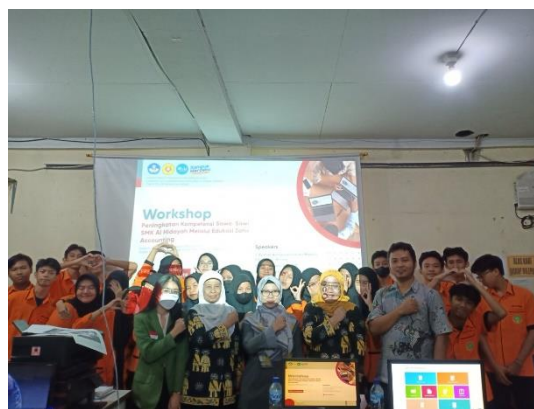
Gambar 1. Pembukaan kegiatan Pelatihan.