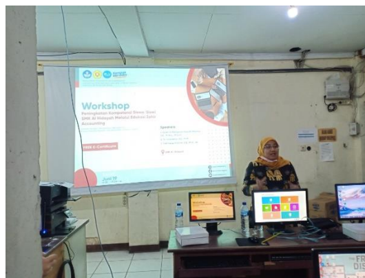
Gambar 3. Penjelasan penggunaan Aplikasi Zahir Desktop