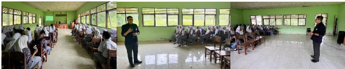
Gambar 1. Proses Pelaksanaan Pengabdian Masyarakat

Hasil pelaksanaan kegiatan menunjukkan bahwa sebagian besar siswa tidak tahu bagaimana mencegah dan mengendalikan vektor nyamuk sebagai pembawa penyakit, dengan rata-rata nilai (41,95%). Namun, setelah diberikan edukasi tentang peran vektor nyamuk sebagai pembawa penyakit dan cara mengendalikannya, sebagian besar siswa dapat mengetahui serta melakukan pencegahan vektor baik di rumah, sekolah dan lingkungan sekitar. Hal tersebut ditunjukkan dengan kenaikan nilai rata-rata pada pengetahuan dan tindakan sebesar (79,38%) yang dapat dilihat pada (Tabel 2 dan Gambar 2). Hasil yang didapatkan sejalan dengan pengabdian lainnya bahwa hasil pretest nilai rata-rata dari (43,7%) meningkat setelah diberikan edukasi sehingga pada pelaksanaan post-test nilai menjadi (74,2%) (Rahman Jabal et al., 2023).