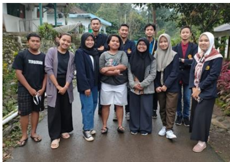
Gambar 2. Tahap Observasi Lapangan

Observasi lapangan yang dilakukan melalui observasi langsung di tempat. Kegiatan observasi langsung yaitu kegiatan wawancara secara langsung dengan karang taruna setempat mengenai kondisi lingkungan setempat dan keperluan warga buta aksara setempat. Kondisi desa yang dekat dengan perkebunan dan merupakan kawasan terpencil tidak padat penduduk dan akses yang jauh ke sekolah lanjutan sehingga banyak masyarakat yang tidak dapat memperoleh akses ke sekolah lanjutan dan membutuhkan bantuan pengajaran sebagai bentuk pengurangan minimnya akses pendidikan.