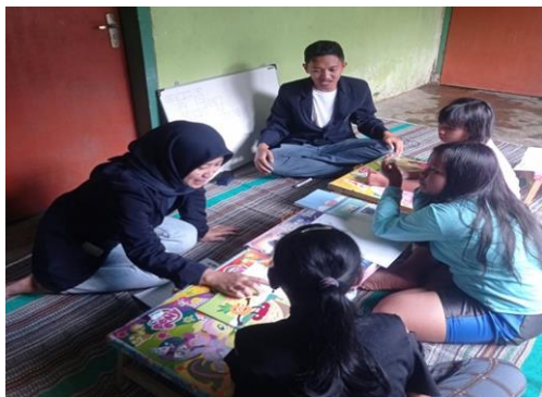
Gambar 6. Kegiatan Indoor Class Numerasi

Pada gambar 6 terlihat murid-murid usia 8-12 tahun sedang belajar matematik materi perkalian dan pembagian.