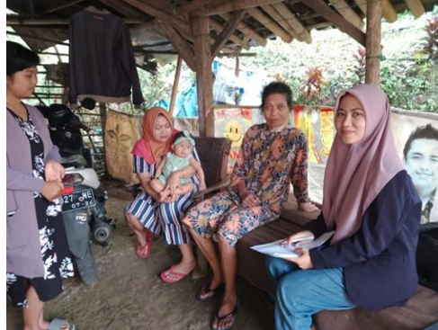
Gambar 4. Pelaksanaan Pre-Test Keaksaraan dan Numerasi

Tahap pelaksanaan kegiatan dilakukan dengan tiga tahapan yaitu, 1) Tahap sosialisasi serta pengenalan kegiatan pelatihan. Tahap ini tim menjelaskan maksud dan tujuan adanya sosialisasi. Adanya permasalahan yang terjadi di lingkungan yaitu akses pendidikan yang jauh dan rendahnya Sumber Daya Manusia (SDM) Sosalisasi ini dilakukan dengan tujuan untuk memberikan motivasi kepada masyarakat secara luas untuk dapat melakukan hal yang serupa ataupun melakukan hal lain yang dapat mengatasi permasalahan-permasalahan yang ada di Indonesia melalui publikasi dan sosialisasi di berbagai media (Abdurrahman, 2015). Sebelum dilakukan pelatihan kepada mitra, maka akan dilaksanakan tes pendahuluan ( pre-test ) untuk mengukur kemampuan mitra serta memilah segmen-segmen pembelajaran yang akan diberikan (Wulandari et al., 2022), 2) Tahap pelaksanaan rumah belajar dengan melakukan renovasi rumah layak pakai di sekitar desa dan mengisi perlengkapan selama mengajar, 3) Tahap pelaksanaan proses pembelajaran di rumah belajar adalah kegiatan pembelajaran dengan indoor dan outing class . Pelaksanaan pembelajaran berfokus kepada pelaksanaan pembelajaran membaca, menulis, dan berhitung.