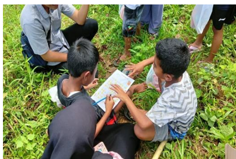
Gambar 8. Kegiatan Outing class

Pada gambar 7 terlihat murid-murid usia 3-7 tahun sedang belajar mengenal bilangan 1-100.