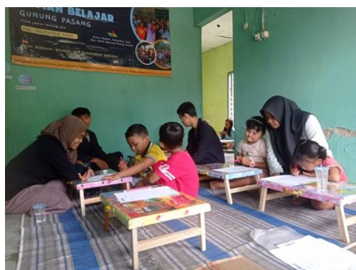
Gambar 7. Kegiatan Indoor Class Numerasi

Pada gambar 6 terlihat murid-murid usia 8-12 tahun sedang belajar matematik materi perkalian dan pembagian.