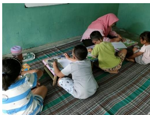
Gambar 5. Pembelajaran Literasi

Tahap pelaksanaan kegiatan dilakukan dengan tiga tahapan yaitu, 1) Tahap sosialisasi serta pengenalan kegiatan pelatihan. Tahap ini tim menjelaskan maksud dan tujuan adanya sosialisasi. Adanya permasalahan yang terjadi di lingkungan yaitu akses pendidikan yang jauh dan rendahnya Sumber Daya Manusia (SDM) Sosalisasi ini dilakukan dengan tujuan untuk memberikan motivasi kepada masyarakat secara luas untuk dapat melakukan hal yang serupa ataupun melakukan hal lain yang dapat mengatasi permasalahan-permasalahan yang ada di Indonesia melalui publikasi dan sosialisasi di berbagai media (Abdurrahman, 2015). Sebelum dilakukan pelatihan kepada mitra, maka akan dilaksanakan tes pendahuluan ( pre-test ) untuk mengukur kemampuan mitra serta memilah segmen-segmen pembelajaran yang akan diberikan (Wulandari et al., 2022), 2) Tahap pelaksanaan rumah belajar dengan melakukan renovasi rumah layak pakai di sekitar desa dan mengisi perlengkapan selama mengajar, 3) Tahap pelaksanaan proses pembelajaran di rumah belajar adalah kegiatan pembelajaran dengan indoor dan outing class . Pelaksanaan pembelajaran berfokus kepada pelaksanaan pembelajaran membaca, menulis, dan berhitung.