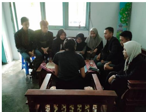
Gambar 3. Kontrak dengan Mitra

Pada gambar 2 merupakan tahap observasi lapangan dengan kegiatan mengobrol dan membahas keadaan di desa Gunung Pasang bersama karang taruna.