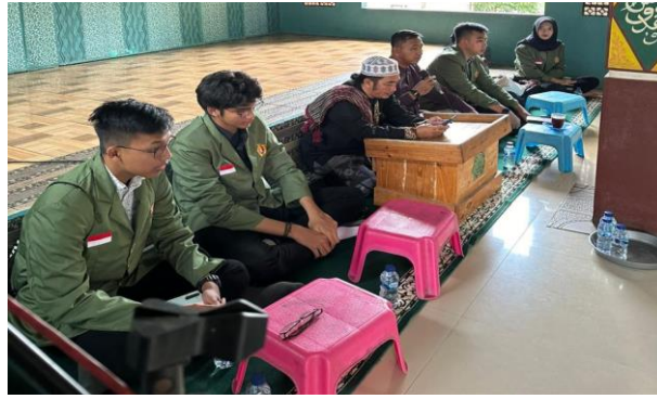
Gambar 3. Pembukaan dan Pengenalan Identitas kampus