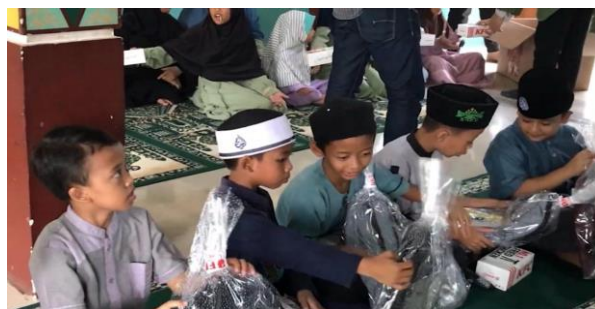
Gambar 5. Pemberian bingkisan