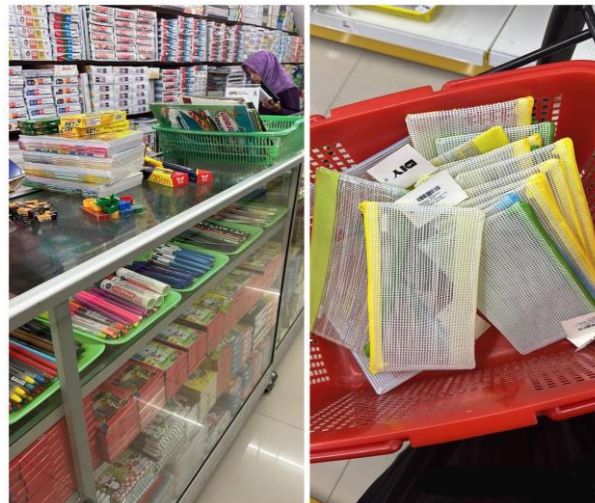
Gambar 2. Pembelian Bingkisan Untuk Anak Yayasan Hidayatul Wildan