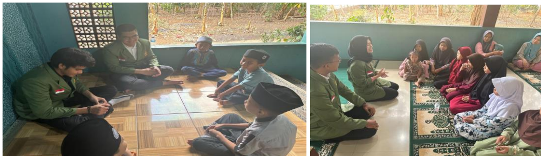
Gambar 4. Praktek Cuci Tangan