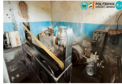
Gambar 5. Kunjungan Lapang ke Instalasi PLTMH di PDP Kebun Gunung Pasang.

Secara umum kegiatan pengabdian masyarakat yang telah dilaksanakan berjalan dengan baik dan lancar. Antusiasme dari para peserta juga sangat tinggi, dilihat dari diskusi dan tanya jawab yang cukup intens dengan para pemateri baik saat pemberian materi di kelas, praktik di laboratorium maupun saat kunjungan lapang. Hasil dari kuesioner yang dibagikan kepada para peserta juga menunjukkan respon yang positif. Umumnya para peserta sangat mengapresiasi kegiatan yang dilaksanakan karena menambah ilmu dan wawasan tentang energi terbarukan yang tidak didapatkan selama belajar di sekolah. Para peserta juga menginginkan ada kegiatan-kegiatan edukatif lainnya yang bisa diikuti untuk lebih mendalami pengetahuan tentang energi terbarukan. Penyuluhan pemanfaatan energi alternatif dan terbarukan sangat bermanfaat untuk membuka wawasan para generasi muda, khususnya para siswa untuk dapat memanfaatkan energi yang melimpah di sekeliling kita (Padang et al., 2020).