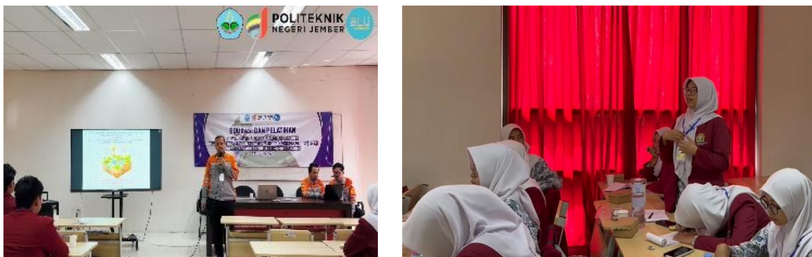
Gambar 2. Pemberian Materi dan diskusi dengan para peserta

Setelah pemberian materi, para peserta diajak untuk keliling dan ditunjukkan penerapan ilmu dan teknologi terkait pemanfaatan energi terbarukan di laboratorium dan workshop yang ada di TeFa Energi Terbarukan antara lain alat peraga PLTS di laboratorium listrik dan pembangkitan daya, kemudian juga melihat dan memahami cara kerja simulator PLTMH maupun teknologi pembuatan bahan bakar nabati (BBN) di Workshop Energi dan Mekanik, serta teknologi kendaraan listrik di laboratorium rekayasa otomotif. Para peserta juga diajarkan untuk merangkai PLTS sederhana dengan sistem Off Grid yang terdiri dari panel surya, baterai, Solar charge controller dan inverter, seperti yang ditunjukkan pada gambar 3. Pada kegiatan ini, tim pelaksana menjelaskan prinsip kerja dan komponen utama dari PLTS Off Grid, kemudian para