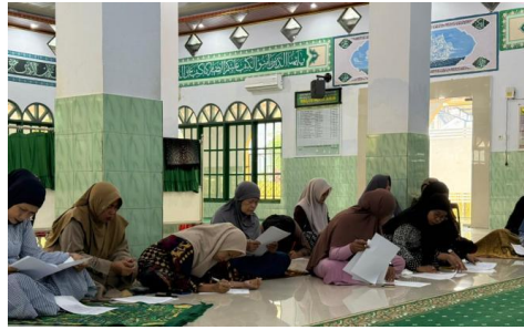
Gambar 1. Pengisian Pre-test

Pre-test ini berfungsi sebagai acuan latar belakang masalah serta untuk melihat gambaran kondisi awal permasalahan kesehatan gigi dan mulut pada lansia. Penyuluhan dilaksanakan oleh tim pengabdian masyarakat Mahasiswa Kedokteran Gigi Profesi FKG UMI yang telah dibagi sesuai dengan peran dan kompetensi masing-masing anggota. Materi yang disampaikan mencakup penjelasan bahwa kuesioner pre-test GOHAI berisikan 12 pernyataan dengan menggunakan skoring 0 (tidak pernah), 1 (hampir tidak pernah), 2 (Kadang-kadang), 3 (cukup sering), 4 (sering), 5 (Selalu) yang bertujuan untuk menilai dampak kondisi gigi dan mulut terhadap aktivitas sehari-hari, termasuk saat makan, berbicara, dan beribadah. Seluruh rangkaian kegiatan ini kemudian didokumentasikan dalam bentuk laporan pengabdian kepada Masyarakat (Atchison KA, 1990; Kementerian Kesehatan RI, 2019).