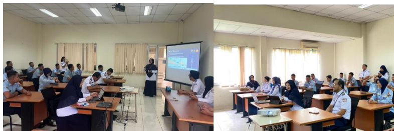
Gambar 2. Penyampaian Materi Kegiatan PKM

Materi yang disampaikan kepada peserta pelatihan mencakup beberapa aspek penting mengenai aerodrome dan water-based aerodrome . Pertama-tama, peserta diperkenalkan dengan klasifikasi aerodrome berdasarkan berbagai kategori, seperti aerodrome sipil dan militer, publik dan privat, serta controlled dan uncontrolled aerodrome . Kemudian, dijelaskan komponen fisik dari aerodrome , termasuk runway dengan penekanan pada orientasi dan penamaan sesuai runway designator serta penerapan sistem koding ICAO seperti Runway Code Number dan Letter . Selain itu, peserta juga mempelajari sistem pergerakan pesawat di darat melalui taxiway dan apron , serta area keselamatan seperti runway strip , RESA , dan clearway atau stopway . Aspek penting lainnya adalah marka dan sistem pencahayaan seperti threshold marking , taxiway centerline , approach lighting system , PAPI , dan runway edge lights . Penjelasan juga diberikan mengenai deklarasi jarak atau declared distances yang mencakup TORA , TODA , ASDA , dan LDA , yang sangat penting untuk prosedur lepas landas dan pendaratan oleh ATC. Sarana pendukung operasional seperti menara kontrol ( control tower ), fasilitas ATC, serta sistem navigasi seperti ILS , NDB/VOR , dan stasiun cuaca turut dijelaskan. Seluruh komponen ini divisualisasikan dalam grid aerodrome untuk memudahkan identifikasi cepat dan akurat oleh peserta.