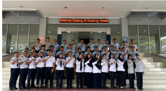
Gambar 5. Penutupan Kegiatan PKM

Secara keseluruhan, tingkat kepuasan mitra dinyatakan sangat baik, dan program ini dianggap memberikan kontribusi positif dalam memperluas wawasan personil ATC TNI AU, khususnya dalam pengenalan terhadap berbagai jenis aerodrome dan tantangan operasionalnya. Evaluasi ini menjadi dasar yang kuat untuk mengembangkan pelatihan sejenis di masa depan dengan cakupan yang lebih luas dan pendekatan yang lebih teknis.