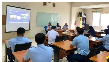
Gambar 1. Pembukaan Kegiatan PKM

Kegiatan diawali dengan sesi pembukaan yang mencakup sambutan dari perwakilan institusi penyelenggara yaitu PPI Curug dan dari TNI AU selaku mitra kegiatan. Pada sesi ini ditekankan pentingnya sinergi antara lembaga pendidikan dan lembaga pertahanan negara dalam rangka penguatan kapasitas sumber daya manusia, khususnya dalam bidang navigasi penerbangan militer. Sambutan juga menyoroti kebutuhan akan pemahaman mendalam mengenai berbagai jenis aerodrome dan peran strategisnya dalam mendukung operasi udara TNI.