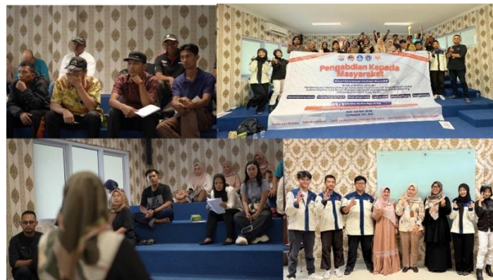
Gambar 2 Kegiatan Pelatihan dasar-dasar sociopreneurship

Program kemudian berlanjut ke tahap pelatihan dan penguatan kapasitas seperti yang terlihat pada gambar 2. Pada 1 Agustus 2025, tim menyelenggarakan pelatihan manajemen bisnis dan sociopreneurship di ruang auditorium Fakultas Ekonomi dan Bisnis Maritim-Universitas Maritim Raja Ali Haji. Peserta dibekali pemahaman mengenai mindset sociopreneur, penyusunan harga pokok produksi (HPP), pencatatan keuangan sederhana, dan pengelolaan usaha harian. Peserta terlihat antusias dan mampu menyusun HPP serta melakukan pencatatan keuangan dasar dengan bimbingan narasumber. Pelatihan tersebut dihadiri 25 peserta yang sebenarnya melebihi jumlah pendaftar yang awalnya 20 orang dan sebanyak 10 peserta berhasil menyusun HPP serta pembukuan sederhana hingga tuntas selama sesi.