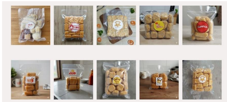
Gambar 4. Hasil Produk Pelatihan ( Nugget Ikan Frozen )

Tahap akhir berupa evaluasi dan keberlanjutan program dilaksanakan pada Oktober–November 2025 melalui forum bersama mitra. Evaluasi dilakukan dengan indikator kuantitatif, seperti jumlah produk terjual, omzet, dan jumlah anggota aktif, serta indikator kualitatif, seperti motivasi, perubahan perilaku, dan kepercayaan diri anggota. Hasil evaluasi menunjukkan adanya transformasi sosial berupa peningkatan solidaritas komunitas dan semangat kewirausahaan. Selain itu, disusun roadmap keberlanjutan program yang meliputi strategi branding, pengembangan jejaring kemitraan, dan legalisasi usaha, sehingga MAPIJEK dapat terus berkembang secara mandiri setelah program PKM berakhir. Dalam evaluasi akhir tercatat bahwa rata-rata penjualan per anggota berkisar 5–10 bungkus per minggu dengan harga jual Rp15.000–Rp20.000 per bungkus, menandai pergeseran dari kondisi awal ketika belum ada usaha terstruktur dan belum tercatat ada pendapatan usaha.