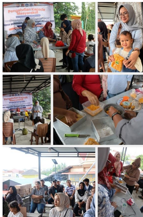
Gambar 3. Pelatihan Pembuatan Nugget Ikan

Sejalan dengan itu, dilakukan pula pembuatan konten digital dan promosi daring pada Agustus–September 2025. Tim bersama mahasiswa memproduksi foto produk, video testimoni, dan narasi promosi yang diunggah ke media sosial dan katalog daring. Konten ini tidak hanya berfungsi sebagai strategi branding, tetapi juga memperluas jangkauan pemasaran produk kuliner MAPIJEK melalui platform digital. Selama periode tersebut diproduksi total 13 bahan promosi digital yang dipublikasikan: 10 foto produk, 2 video promosi, dan 1 poster promosi. Conoth foto produk dapat dilihat pada gambar 4.