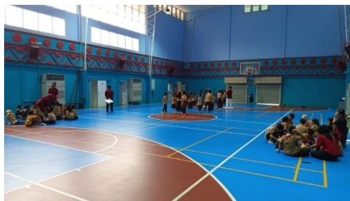
Gambar 3. Pengelompokan dan Latihan Kerja Tim

Makna yang terkandung dalam permainan menyusun menara kartu adalah nilai pantang menyerah yang menjadi cerminan nyata dari daya lenting ( resilience ). Dalam proses permainan, menara yang sering roboh memberikan pengalaman langsung kepada siswa tentang bagaimana menghadapi kegagalan dengan sikap positif. Mereka diajak untuk tidak melihat kegagalan sebagai akhir dari usaha, melainkan sebagai kesempatan untuk belajar, memperbaiki strategi, dan mencoba kembali dengan cara yang lebih baik. Setiap kali menara runtuh, siswa dilatih untuk mengendalikan emosi, tetap tenang, dan mencari solusi agar bangunan berikutnya lebih kokoh. Melalui pengalaman ini, tertanam pemahaman bahwa keberhasilan tidak datang secara instan, tetapi merupakan hasil dari ketekunan, kesabaran, dan semangat pantang menyerah dalam menghadapi berbagai rintangan.