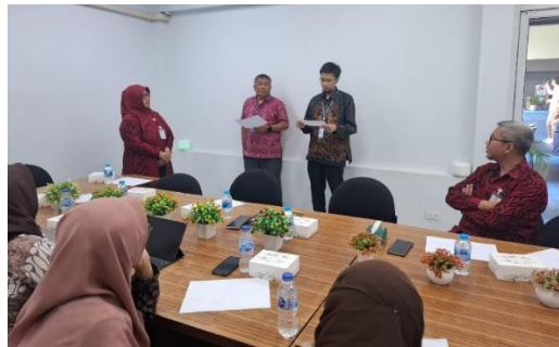
Gambar 1. Penguatan Resiliensi Pada Guru Sekolah Indonesia Bankok

Pelatihan resiliensi bagi siswa Sekolah Indonesia Bangkok dilaksanakan di Aula Sekolah Indonesia Bangkok dan Lapangan olahraga Sekolah Indonesia Bangkok. Kegiatan diikuti oleh 51 siswa tingkat Sekolah Dasar kelas IV–VI. Kegiatan dimulai dengan ice breaking untuk mencairkan suasana dan membangun keakraban antara fasilitator dengan peserta. Siswa tampak bersemangat mengikuti permainan awal yang mendorong kerja sama serta keberanian tampil. Setelah suasana kondusif, fasilitator menyampaikan materi pengenalan resiliensi dengan media presentasi interaktif. Materi menekankan pentingnya kemampuan mengendalikan emosi, berpikir positif, dan bangkit kembali ketika menghadapi kesulitan.