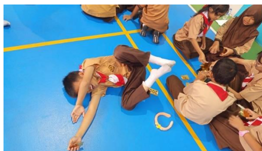
Gambar 4. Pelatihan Pengendalian Emosi

Hasil observasi menunjukkan bahwa lebih dari 90% siswa aktif terlibat dalam setiap kegiatan dan mampu mengungkapkan pendapatnya selama diskusi. Guru pendamping juga berperan penting dalam membantu siswa memahami pesan-pesan reflektif yang muncul dari setiap aktivitas. Secara umum, tahapan pelaksanaan berjalan lancar dan sesuai dengan rencana kegiatan.