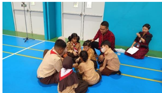
Gambar 2. Penguatan Resiliensi Pada Siswa Melalui Permainan Menyusun Menara

Untuk memperdalam pemahaman, siswa diajak mengikuti permainan resiliensi menyusun menara dari kartu. Permainan ini mengajarkan siswa tentang kesabaran, strategi, dan kerja sama. Saat menara runtuh, siswa didorong untuk tetap tenang, mencoba kembali, dan tidak menyerah. Dari kegiatan ini, siswa belajar bahwa kegagalan bukan akhir, melainkan kesempatan untuk memperbaiki strategi. Selain itu, dilakukan juga simulasi peran (role play) tentang bagaimana menghadapi tantangan sehari-hari, seperti mengatasi rasa kecewa, menyelesaikan konflik kecil, serta mendukung teman yang sedang kesulitan. Aktivitas ini dirancang agar siswa berlatih menghadapi situasi nyata dengan cara yang sehat dan adaptif.