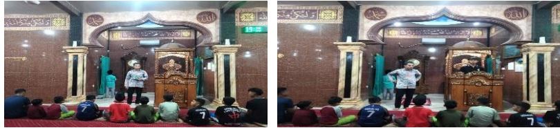
Gambar 3. Kegiatan Pengajian & Praktik Khutbah Terstruktur

mereka kesulitan menentukan topik khutbah yang menarik dan relevan bagi masyarakat. Hal ini menunjukkan adanya kesenjangan antara kemampuan konseptual dan aplikatif dalam praktik dakwah di kalangan remaja masjid. Oleh karena itu, rancangan pelatihan disusun untuk menggabungkan antara teori (melalui pengajian tematik) dan praktik langsung (melalui simulasi khutbah).