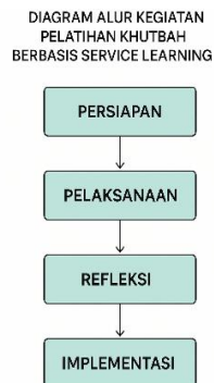
Gambar 1. Diagram Alur Kegiatan

interaktif (Matthew B. Miles, A. Michael Huberman 2014), meliputi reduksi data, penyajian data, serta penarikan kesimpulan dan verifikasi. Keabsahan data dijaga melalui triangulasi sumber dan metode serta member check dengan peserta. Berikut ini diagram alur kegiatan yang akan di laksanakan: