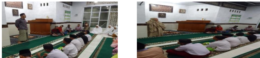
Gambar 2. Kegiatan Pembukaan Pelatihan Khutbah Jum'at Bersama Jamaah Sekaligus Pelatihan