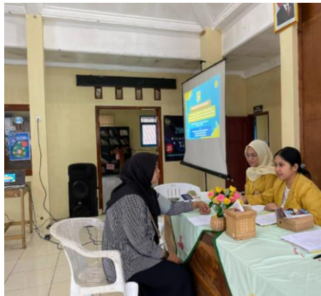
Gambar 3. Pengukuran tekanan darah warga

Usia warga yang menjadi target pemeriksaan adalah umur 30 tahun ke atas karena pada umur tersebut metabolisme biokimia tubuh sudah mulai menurun, akibatnya dapat menimbulkan ketidak normalan metabolisme dan berakibat timbulnya beberapa penyakit (Jerita Eka Sari et al., 2021)