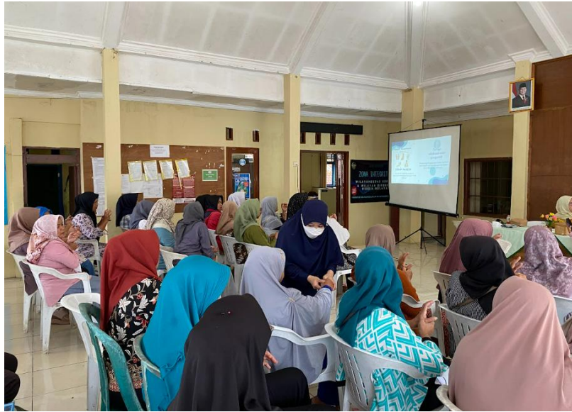
Gambar 6. Edukasi Menurunkan Hipertensi melalui Terapi AKU-RESIK