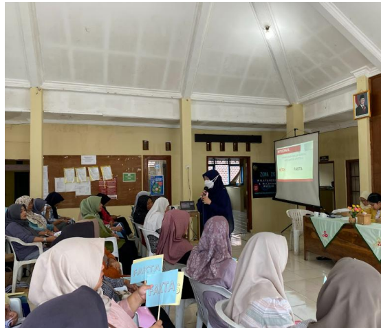
Gambar 7. Edukasi pencegahan hipertensi pada warga Desa Karangsalam Lor Kecamatan Baturraden