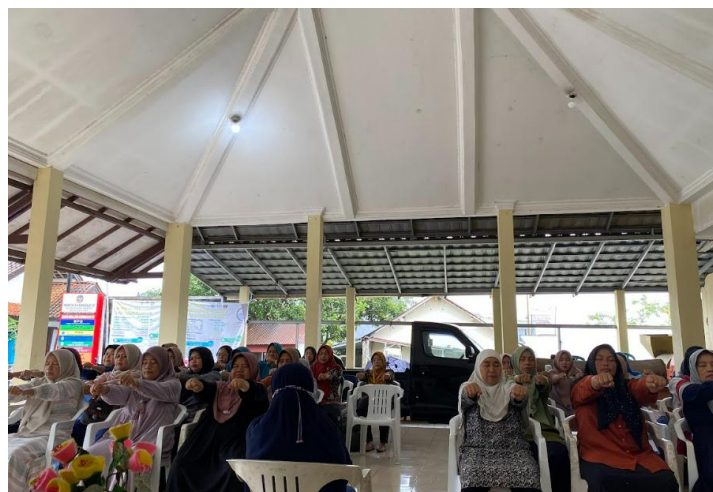
Gambar 8. Pelatihan Terapi AKU-RESIK pada warga untuk menurunkan hipertensi

Rata-rata pengetahuan warga tentang pencegahan hipertensi sebelum edukasi sebanyak 6,5 sedangkan setelah edukasi rata-rata pengetahuan meningkat menjadi 9. Hasil pengukuran