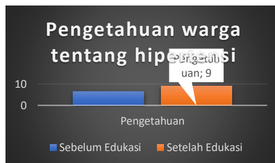
Gambar 5. Hasil pengukuran pretest dan posttest pengetahuan warga tentang pencegahan hipertensi

Hasil Pengukuran Pengetahuan Warga tentang Pencegahan Hipertensi