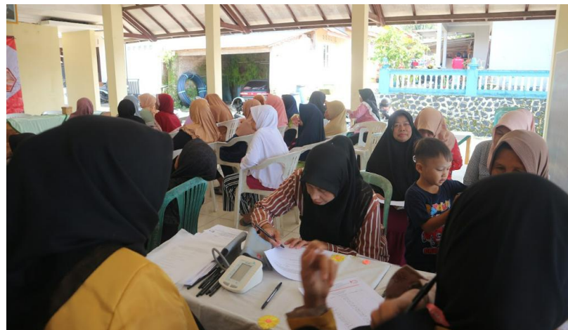
Gambar 2. Pengisian pretest sebelum penerapan terapi AKU-RESIK

Warga Desa Karangsalam Lor Kecamatan Baturraden sebanyak 44 orang dengan 42 orang perempuan dan 2 orang laki-laki.