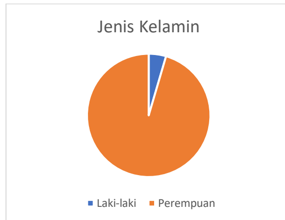
Gambar 1. Peserta berdasarkan jenis kelamin

Pelaksanaan kegiatan pada Rabu 30 Juli 2025 jam 8.30 WIB di Aula Balai Desa Karangsalam Lor Kecamatan Baturraden. Mitra yang dilibatkan dalam program PKM Berbasis Riset ini adalah klien dengan hipertensi Desa Karangsalam Lor Kecamatan Baturraden sebanyak 44 peserta. Peran peserta tersebut sangat vital untuk menunjang keberhasilan program karena sebagai pihak primer yang berkaitan langsung dengan perawatan dan pengendalian hipertensi. Tim Pengabdian dibantu oleh 4 mahasiswa.