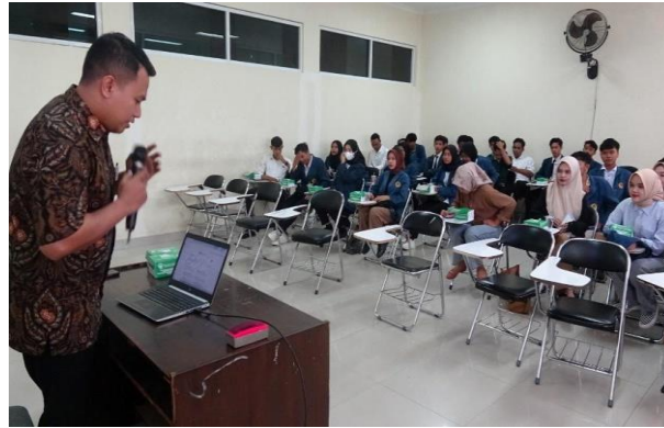
Gambar 5: Suasana Pelatihan Penggunaan Aplikasi Mendeley.