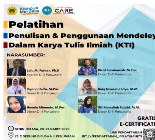
Gambar 1. Pamflet Pelatihan Aplikasi Mendeley

Kegiatan pelatihan ini diawali dengan melakukan observasi atau pengamatan langsung kepada mahasiswa prodi pariwisata yang sedang melakukan bimbingan dan ujian akhir penelitian, serta menanyakan langsung kepada masing-masing informan terkait pengetahuan pengetahuan mereka tentang aplikasi mendeley. Setelah observasi dan wawancara dilakukan, dilanjutkan dengan focus group discussion dengan pengelola prodi dalam hal ini adalah ketua prodi dan sekretaris prodi pariwisata unram untuk menentukan sasaran mahasiswa yang akan mengikuti pelatihan ini dan diputuskan mahasiswa, yang mengikuti pelatihan ini yaitu mahasiswa semester akhir Angkatan tahun 2020/2021 yang akan diwisuda pada tahun 2023 berjumlah 40 orang. Setelah peserta telah ditentukan, tim menyebarkan pamflet sebagai informasi kepada peserta terkait jadwal kegiatan, berikut pamflet kegiatan pelatihan Mendeley di prodi pariwisata universitas mataram: