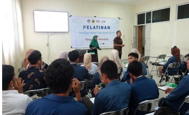
Gambar 6. Suasana Pelatihan Penggunaan Aplikasi Mendeley.