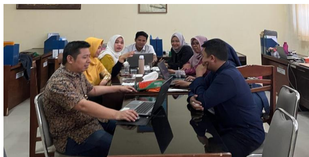
Gambar 2. Suasana Diskusi Tim Pengabdian dengan Pengelola Prodi Pariwisata.

Sebelum pelaksanaan kegiatan pelatihan dilakukan, tim pengabdian melakukan koordinasi antar tim dan pengelola program studi pariwisata untuk menentukan jadwal kegiatan dan peserta yang menghadiri pelatihan penggunaan aplikasi Mendeley. Berikut diskusi tim pengabdian dan pengelola prodi pariwisata universitas mataram dapat dilihat pada gambar dibawah ini: