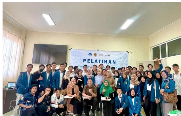
Gambar 7. Foto Bersama dengan Peserta Pelatihan.

Berdasarkan Gambar 5, 6, dan 7 menunjukkan bahwa proses pelaksanaan penyampaian materi berjalan dengan baik dan lancar. Tim pengabdian menyampaikan materi secara keseluruhan dan dilanjutkan dengan praktek oleh masing-masing peserta. Dan pada akhir kegiatan, tim dan peserta melakukan proses foto bersama sekaligus penutupan proses pelatihan penggunaan aplikasi Mendeley pada mahasiswa prodi pariwisata universitas mataram. Setelah proses penyampaian materi selesai, tahapan selanjutnya adalah memberikan post-test kepada