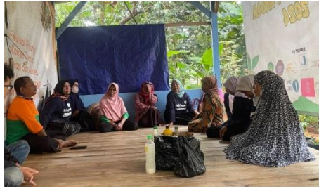
Gambar 2. Proses Penyuluhan Pupuk Kompos Cair (PKC) di Balai Sawala Dusun Nagrog