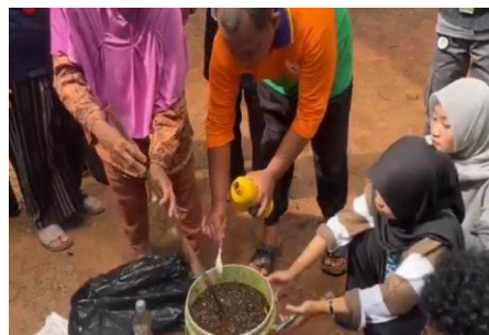
Gambar 4. Penambahan air dan probiotik (EM4) pada limbah pisang yang telah dipotong-potong

Kemudian setelah 14 hari menjalani proses fermentasi dalam wadah tertutup, tepatnya pada bulan Mei, cairan hasil fermentasi yang telah dibuat diperiksa terlebih dahulu karena untuk memastikan adanya perubahan warna, aroma, dan tekstur yang menandakan bahwa proses pengomposan telah selesai. Kemudian cairan hasil fermentasi dipanen dengan menyaring cairan dari sisa padatan bahan, lalu menuangkannya kedalam botol plastik sebagai tempat penyimpanan. Dari 2,5 kg limbah yang difermentasi dihasilkan sekitar 1,7 liter PKC dengan rendeman sekitar 0,68 L per kg Limbah, yang sesuai dengan kisaran ideal hasil fermentasi