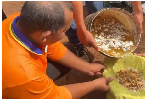
Gambar 5. Penyaringan pupuk kompos cair dari endapan limbah pisang yang sudah di fermentasi selama 14 hari

Secara fisik, pupuk kompos cair yang dihasilkan berwarna coklat tua hingga kehitaman, memiliki aroma khas fermentasi tetapi tidak menyengat (seperti bau tape), bau nya cenderung asam ringan dan tidak berbau busuk. Tekstur cair dan tidak mengandung partikel kasar, menandakan bahwa proses dokomposisi berjalan dengan baik. Tidak ditemukan endapan berlebihan yang menandakan adanya keseimbangan bahan karbon dan nitrogen yang cukup stabil selama proses fermentasi berlangsung.