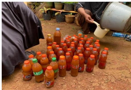
Gambar 6. Proses pengemasan pupuk kompos cair ke dalam botol plastik 220ml

Pupuk kompos cair ini diuji coba langsung oleh masyarakat dengan pengenceran 1:10, menggunakan air bersih lalu diaplikasikan ke tanaman sayuran dan tanaman pekarangan. Aplikasi dilakukan dengan cara disiramkan ke media tanaman di sekitar akar. Beberapa masyarakat yang mencoba melaporkan bahwa tanaman terlihat lebih segar dibanding sebelumnya. Meskipun uji laboratorium kandungan hara belum dilakukan, berdasarkan ciri fisik dan efek pada tanaman, pupuk kompos cair tersebut dinilai berkualitas dan layak digunakan sebagai pupuk organik alternatif.