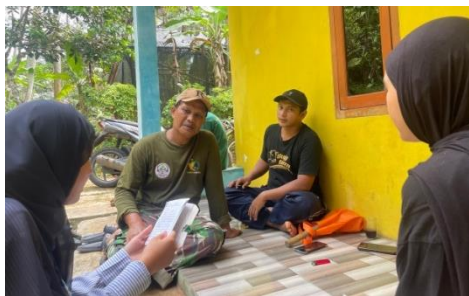
Gambar 1. Observasi dan wawancara kepada masyarakat Dusun Nagrog

Kegiatan pengabdian kepada masyarakat ini dilakukan pada Bulan Februari hingga Bulan Mei 2025. Pada bulan Februari dan Maret, tim melakukan kegiatan dengan mengidentifikasi potensi dan permasalahan yang ada di Dusun Nagrog. Dari hasil observasi dan diskusi awal, dapat diketahui bahwa pohon pisang merupakan komoditas lokal yang tumbuh melimpah di Dusun Nagrog. Karena kondisi tanah yang subur, curah hujan yang cukup, menjadikan pohon pisang bisa tumbuh dengan baik di Dusun Nagrog. Hampir setiap rumah tangga memiliki tanaman pisang, baik untuk dikonsumsi sendiri ataupun untuk diperjual belikan. Namun, selama ini masyarakat Dusun Nagrog belum ada aksi dalam mengolah limbah pohon pisang, sebagian masyarakat hanya memotong bagian batang kemudian dibiarkan membusuk dikebunnya dengan harapan batang yang dipotong-potong tersebut bisa membusuk dan menjadi pupuk secara alami. Padahal batang pisang memiliki kadar senyawa organik dengan selulosa sekitar 50%. Batang pisang juga mengandung kalium, nitrogen, dan fosfor yang tinggi dan mampu meningkatkan kesuburan tanah bila difermentasi menjadi pupuk kompos cair (Sholikah et al., 2025).