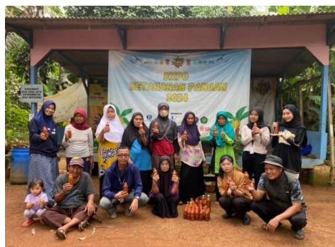
Gambar 7. Pembagian pupuk kompos cair kepada masyarakat agar dimanfaatkan secara mandiri

Pupuk kompos cair ini diuji coba langsung oleh masyarakat dengan pengenceran 1:10, menggunakan air bersih lalu diaplikasikan ke tanaman sayuran dan tanaman pekarangan. Aplikasi dilakukan dengan cara disiramkan ke media tanaman di sekitar akar. Beberapa masyarakat yang mencoba melaporkan bahwa tanaman terlihat lebih segar dibanding sebelumnya. Meskipun uji laboratorium kandungan hara belum dilakukan, berdasarkan ciri fisik dan efek pada tanaman, pupuk kompos cair tersebut dinilai berkualitas dan layak digunakan sebagai pupuk organik alternatif.