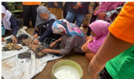
Gambar 3. Proses praktik pemotongan limbah pisang menggunakan alat sederhana

Kemudian tahapan yang kedua ialah tahapan pelaksanaan melalui pendekatan Demplot ( Demonstration Plot ) yang memungkinkan masyarakat untuk terlibat langsung dalam proses pembuatan pupuk kompos cair. Tahap ini dimulai dengan penyuluhan mengenai manfaat pengolahan limbah pisang, diikuti dengan praktik teknis pembuatan pupuk kompos cair menggunakan batang pisang dan kulit buah pisang yang dicacah menggunakan pisau secara manual oleh peserta kegiatan, kemudian dicampur dengan air, kemudian menambahkan probiotik (praktik ini menggunakan EM4) dan kemudian menambahkan molase, lalu difermentasi selama 10-14 hari. Dengan proses pengadukan ringan setiap 2-3 hari sekali untuk menjaga aktivitas mikroorganisme tetap stabil. Wadah diletakkan di tempat yang teduh, tidak terkena sinar matahari langsung, dan memiliki suhu ruangan yang stabil untuk mendukung fermentasi lebih optimal. Keberhasilan fermentasi bahan organik seperti kulit pisang sangat dipengaruhi oleh teknik pengolahan dan penggunaan aktivator yang tepat, seperti penggunaan probiotik (Anggraini et al., 2021). Pendekatan ini terbukti efektif karena limbah batang pisang dapat difermentasi menjadi pupuk kompos cair berkualitas melalui cara yang sederhana.