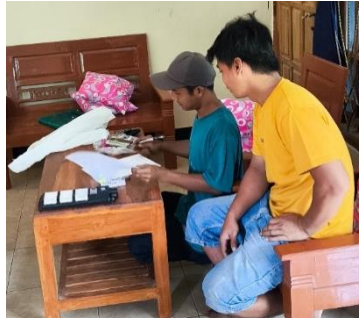
Gambar 3. Persetujuan dengan ketua RT

sebagai syarat administrasi kelengkapan pengabdian dan yang paling penting warga masyarakat menerimanya dalam bentuk persetujuan yang diakili oleh ketua rt setempat, kegiatan ini terdokumentasi seperti pada gambar 3.