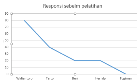
Gambar 2. Responsi sebelum pelatihan

desa ini ada yang menguasai elektronika sehingga bila nanti ada perawatan lanjut dapat menggunakan jasanya. Keberlanjutan penggunaan PLTS ini dapat terlaksana dengan adanya kebersamaan antar masyarakat. Kalau terjadi kerusakan lebih parah misalkan pecah panelnya ini tidak bisa diperbaiki maka harus ada penggantian hal ini kita serahkan kepada warga masyarakat untuk dapat musyawarah untuk dapat mengatinya terutama biaya yang timbul untuk pengantiannya. Komponen-komponen sudah ada dipasaran sehingga bisa dengan cepat dan mudah untuk mengatinya yang sesuai atau bisa ditingkat yang lebih baik lagi. Tim pengabdian juga sudah meninggalkan kontak sehingga bisa memberi saran apabila perawatan ini belum bisa dipecahkan. Untuk mengukur efektivitas pelatihan, dilakukan pre-test dan post-test yang menunjukkan peningkatan pemahaman masyarakat secara signifikan. Masyarakat dilatih cara menginstallasi, mengoperasikan panel surya dan bagaimana cara merawat agar lampu bisa digunakan terus menerus. Responsi cara installasi, mengoperasikan dan merawat panel surya sebelum di beri pelatihan menunjukkan ada sebagian masyarakat yang sudah paham dan kebanyakan belum pernah menginstallasi, mengoperasikan dan merawat hasil sebagai gambar 2: