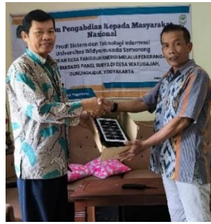
Gambar 5. Penyerahan lampu kepada tokoh masyarakat

Penyerahan lampu penerangan jalan kepada tokoh masyarakat yang ikut mendukung kegiatan samapai terlaksana kegiatan pengabdian masyarakat seperti pada gambar 5.