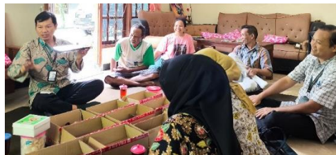
Gambar 7. Pelatihan dalam menggunakan dan merawat lampu

Pelatihan mengoperasikan, perawatan berkala kepada masyarakat yang diberi tanggung jawab khusus dalam melaksanakan. Sebelum memberikan pelatihan penulis membuat kuesioner terkait teknologi dan cara perawatan, kemudian memberikan pelatihan cara merawat dan mengoperasikan lampu tenaga surya seperti pada gambar 7.