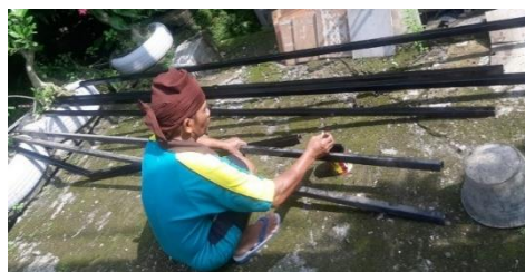
Gambar 6. Pekerjaan memuat tiang penerangan

Lampu penerangan jalan juga ditempel pada pagar yang memungkinkan untuk dipasang, Pekerjaan membuat tiang penerangan jalan oleh masyakat dan tukang besi yang difinising dengan cat agar tambah rapi dan tahan lama seperti pada gambar 6.