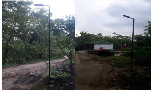
Gambar 8. Penerangan jalan

memperluas jangkauan penerangan hingga ke wilayah pedesaan terpencil berkat pemilihan lokasi yang tepat berdasarkan hasil musyawarah masyarakat. Dengan demikian, penempatan lampu tenaga surya di Desa Watugajah tidak hanya berfokus pada aspek teknis semata, tetapi juga menekankan partisipasi aktif masyarakat dalam pengambilan keputusan. Pendekatan ini terbukti mendukung peningkatan keamanan, kenyamanan, dan mobilitas warga pada malam hari, sekaligus memperkuat rasa memiliki terhadap infrastruktur yang dibangun. Pemasangan dilakukan oleh masyarakat berdasarkan musyawarah, dilakukan pemilihan tempat yang paling rawan termasuk kondisi jalan yang belum bagus dan membahayakan jika perjalanan pada malam hari seperti gambar 8 berikut: