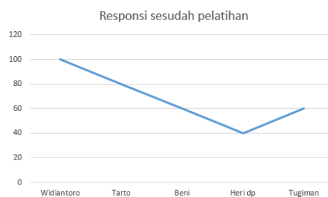
Gambar 4. Responsi setelah pelatihan

Pelaksanaan program penerangan jalan berbasis energi terbarukan, telah diidentifikasi sejumlah permasalahan prioritas yang mencakup dua bidang utama, yaitu aspek teknis dan sosial-ekonomi. Permasalahan tersebut telah disepakati bersama mitra sasaran melalui diskusi dan survei lapangan. Pemenuhan penerangan jalan dengan energy terbarukan menggunakan surya panel dengan memanfaatkan sinar matahari yang akan dirubah menjadi tegangan listrik. Masyarakat diberikan wawasan teknologi ini tersedia sepanjang tahun. dilatih untuk mengoperasikan dan merawat sell surya yang digunakan untuk penerangan jalan. Menentukan titik-titik sport yang perlu disediakan penerangan jalan. Hasil setelah dilakukan pelatihan menunjukkan masyarakat memahami cara melakukan installasi perangkat penerangan jalan mulai dari awal lampu dipasang sampai uji fungsi lampu penerangan jalan, ada peningkatan masyarakat cara mengoperasikan lampu penerangan jalan, ada peningkatan masyarakat dalam melakukan perawatan berkala harian, perawatan bulanan dan perawatan tahunan. Perawatan pembangkit tenaga surya ini ada peningkatan dengan hasil seperti yang ditunjukkan pada gambar 4 berikut ini.