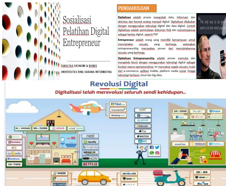
Gambar 4. Materi pengenalan Kewirausahaan Digital