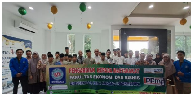
Gambar 6. Akhir kegiatan pelatihan Kewirausahaan Digital

Praktek kewirausahaan digital yang dilakukan oleh peserta, diakhiri dengan pengisian kuisisioner kepuasan pelaksanaan kegiatan pelatihan. Gambar 6 merupakan gambar dari akhir workshop yang menunjukkan kepuasan peserta workshop yang berasal dari mitra Yayasan Rumah Harapan Cikarang Kabupaten Bekasi.