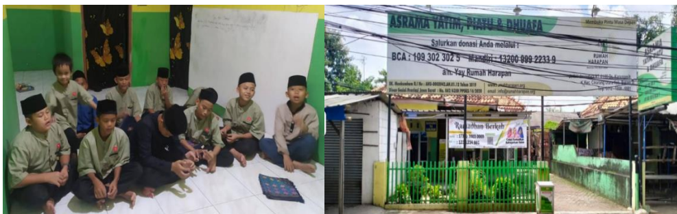
Gambar 1. Yayasan Rumah Harapan Pilar Cikarang Bekasi

Yayasan Rumah Harapan Cikarang (Gambar 1) merupakan yayasan yang menaungi anak-anak berusia remaja. Yayasan ini terletak di Jl. Ki Hajar Dewantara No.33, Karangasih, Kec. Cikarang Utara, Kabupaten Bekasi, Jawa Barat 17530. Berjarak sekitar 41,5 KM dari Kampus Universitas Bina Sarana Informatika.