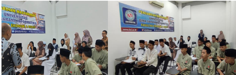
Gambar 5. Praktek Kewirausahaan Digital

Setelah penyampaian materi selesai, peserta mitra Yayasan Rumah Harapan Pilar Cikarang Kabupaten Bekasi mempraktekan langsung digital entrepreneurship di Handphone peserta masing-masing dengan jaringan wifi yang disediakan di lokasi pelatihan yang dipandu oleh narasumber. Kegiatan praktek digital entrepreneurship peserta disajikan pada gambar 5.