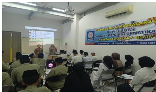
Gambar 3. Penyampaian materi pengenalan Kewirausahaan Digital

Kegiatan Pengabdian masyarakat dilakukan di Universitas Bina Sarana Informatika dengan nara sumber yang terdiri dari 4 orang dosen Manajemen. Dosen manajemen sebagai narasumber workshop memberikan pelatihan bagaimana mengimplementasi digital entrepreneurship agar dapat menjadi kesiagaan dalam mengelola usaha. Pelatihan ini diikuti oleh peserta Mitra Yayasan rumah Harapan Pilar Kabupaten Bekasi pada hari Sabtu tanggal 12 April 2025 pukul 09.00 – 12.00 WIB bertempat di Universitas Bina Sarana Informatika kampus Cikarang. Kegiatan pemaparan materi pelatihan disajikan pada gambar 3.