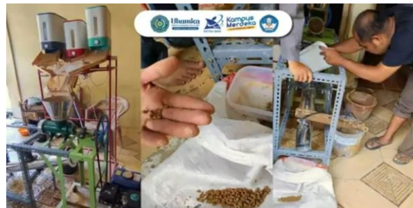
Gambar 6. Pelatihan Pembuatan Pakan Ikan Menggunakan Mesin Pakan Ikan

Pada proses awal bahan-bahan ini dicampurkan dan diaduk selama 5 menit menggunakan mesin pengaduk. Selanjutnya bahan yang sudah tercampur dalam kondisi kalis jatuh ke mesin penggilingan. Bahan digiling sekaligus dicetak sampai ukuran 0,6 mm. selanjutnya bahan dijatuhkan ke oven pemanas dari sumber listrik yang sudah dilengkapi dengan lempeng pemanas dalam terowongan dan didalamnya dilengkapi dengan blower untuk sekaligus untuk mengeringkan dan menjatuhkan pakan ikan di wadah penampungan. Seperti terlihat pada gambar 6 dibawah ini.