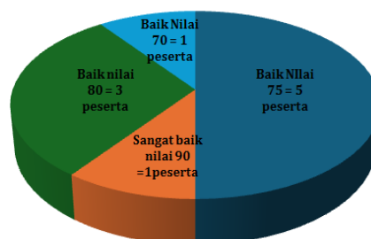
Gambar 8. Tampilan busur lingkaran hasil postest peserta

Pada tabel 2 dan gambar 8, memperlihatkan hasil questioner yang diberikan pada session postest rata-rata diperoleh hasil yang baik. Lebih mendetil dijelaskan dalam diagram Pie Chart diatas dimana separuh dari jumlah (5 dari 10) peserta memperoleh nilai 75 yaitu Baik, sedangkan hanya 1 orang peserta yang memperoleh nilai sangat baik (90) selebihnya peserta memperoleh nilai 70 dan 80, jadi rata-rata peserta dalam menguasai materi pakan ikan yang disampaikan sudah berhasil mengerti dan menguasai cara pembuatan pakan ikan mandiri.