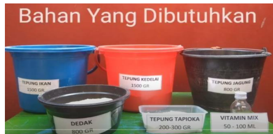
Gambar 5. Beberapa Bahan Yang Dibutuhkan Untuk Pembuatan Pakan Ikan

Tahap implementasi program berikutnya adalah pelaksanaan kegiatan pelatihan. Kegiatan pelatihan dilaksanakan dengan melakukan praktek langsung menggunakan mesin Cetak pakan ikan dalam memproduksi pakan ikan lele. Kegiatan pelatihan diawali dengan penjelasan berbagai alat dan bahan yang digunakan dalam proses pembuatan pakan ikan. Bahan pembuat pakan ikan lele yang sederhana adalah Tepung dedak, Tepung Tapioka, Tepung Ikan, Tepung jagung, Tepung kedelai, Vitamin ditambah sedikit air. (Tell, Abell, Mali, & Maure, 2023) Adapun komposisi masing-masing bahan Protein 56%, Karbohidrat 22%, Vitamin 3%, Lemak 13%, Serat 4%, Mineral 2% (Rosyidah, Ediati, Murwani, Shomadany, & Humaira, 2024).