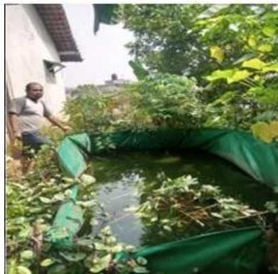
(b) Tambak Pak Zainal