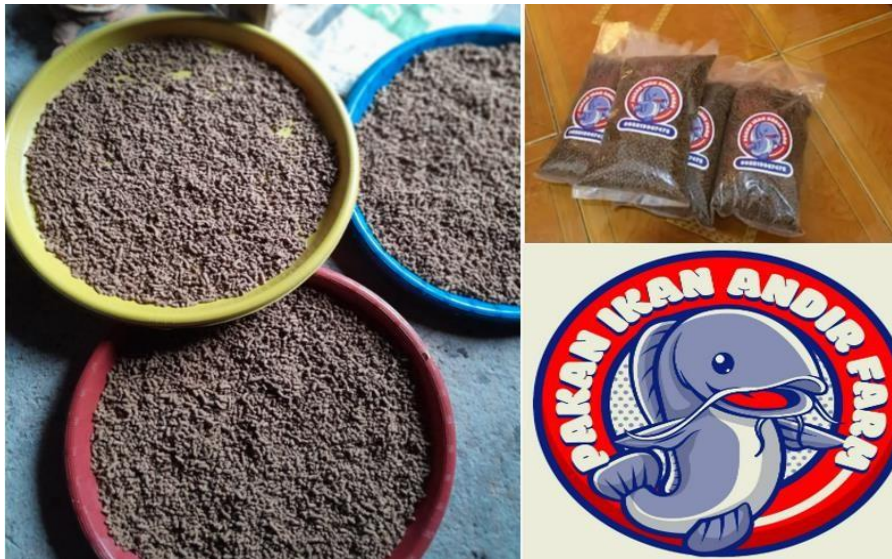
Gambar 7. Pakan hasil pelatihan yang dilakukan oleh mitra

Secara keseluruhan motivasi dan pengetahuan peserta dalam membuat pakan ikan dengan menggunakan mesin pakan ikan dalam kegiatan pengabdian masyarakat ini lebih meningkat setelah anggota Andir Farm mencoba mempraktekkan pembuatan pakan ikan lele secara mandiri. Hal ini dapat dilihat dari antusias peserta dalam menyimak materi dan praktek yang diberikan. Peningkatan kemampuan peserta ini terukur melalui Kuesioner (pada tabel 2) yang menunjukkan bahwa peserta mampu menguasai keterampilan pembuatan pakan ikan.