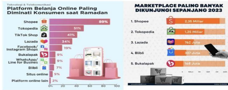
Gambar 4. Beberapa plat forme-commerce