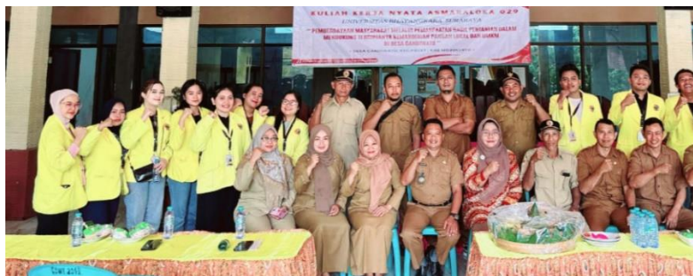
Gambar 2. Pelaksanaan PKM