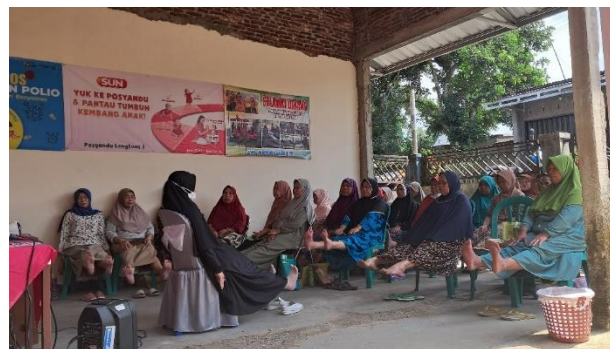
Gambar 8. Pelatihan Terapi BEN-RESIK pada warga untuk menurunkan hipertensi

Rata-rata pengetahuan warga tentang pencegahan hipertensi sebelum edukasi sebanyak 7,5 sedangkan setelah edukasi rata-rata pengetahuan meningkat menjadi 9,5. Hasil pengukuran pengetahuan warga terkait pencegahan hipertensi menunjukkan adanya peningkatan pengetahuan pencegahan hipertensi pada warga dengan beda mean sebesar 2. Peningkatan pengetahuan pada warga setelah warga menerima edukasi pencegahan hipertensi melalui terapi kombinasi relaksasi oto progressif dan terapi musik (Terapi BEN-RESIK)