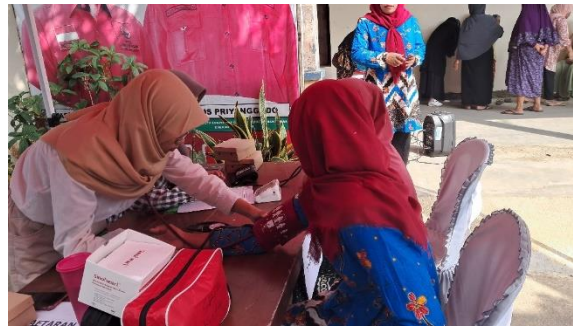
Gambar 3. Pengukuran tekanan darah warga

Usia warga yang menjadi target pemeriksaan adalah umur 30 tahun ke atas karena pada umur tersebut metabolisme biokimia tubuh sudah mulai menurun, akibatnya dapat menimbulkan ketidak normalan metabolisme dan berakibat timbulnya beberapa penyakit (Jerita Eka Sari et al., 2021). Hasil Pengukuran Pengetahuan Warga tentang Pencegahan Hipertensi terdapat pada Gambar 5.