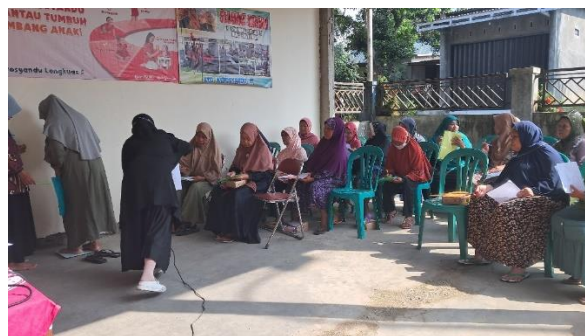
Gambar 2. Pengisian pretest sebelum penerapan terapi BEN-RESIK

Warga Desa Banteran Kecamatan Sumbang sebanyak 40 orang dengan 38 orang perempuan dan 2 orang laki-laki.