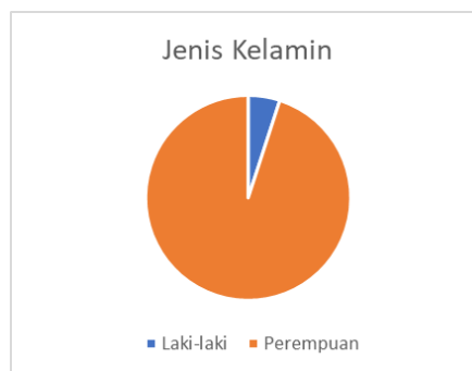
Gambar 1. Peserta berdasarkan jenis kelamin

Pelaksanaan kegiatan pada Rabu 31 Juli 2024 jam 8.30 WIB di Rumah Kader Posyandu lansia RW 5 Desa Banteran Kecamatan Sumbang. Mitra yang dilibatkan dalam program PKM penerapan IPTEKS ini adalah klien dengan hipertensi Desa Banteran Kecamatan Sumbang sebanyak 40 peserta. Peran peserta tersebut sangat vital untuk menunjang keberhasilan program karena sebagai pihak primer yang berkaitan langsung dengan perawatan dan pengendalian hipertensi. Tim Pengabdian dibantu oleh 4 mahasiswa.