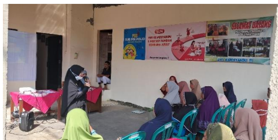
Gambar 6. Edukasi Menurunkan Hipertensi melalui Terapi BEN-RESIK