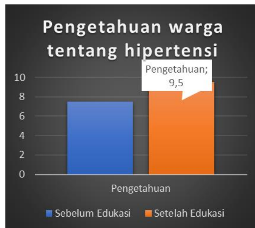
Gambar 5. Hasil pengukuran pretest dan posttest pengetahuan warga tentang pencegahan hipertensi