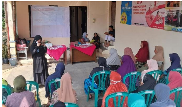
Gambar 7. Edukasi pencegahan hipertensi pada warga Desa Banteran Kecamatan Sumbang