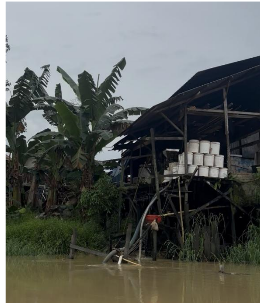
Gambar 4. Salah Satu Pabrik Tahu di Pinggiran Sungai Karang Mumus

Selain mendapatkan edukasi informatif melalui susur daerah aliran sungai Karang Mumus, peserta yang terdiri dari Mahasiswa dan Dosen juga melakukan penanaman pohon seperti mangga, petei, durian, cimpedak dan lainnya sebagai bentuk nyata dari upaya rehabilitasi, konservasi dan perlindungan lingkungan untuk memulihkan fungsi ekosistem yang telah rusak atau menurunnya kualitas sungai. Melalui peran aktif Masyarakat, terutama pada Lokasi rawan banjir merupakan upaya untuk mengurangi risiko bencana melalui kesadaran, peningkatan kemampuan menghadapi bencana, serta penerapan upaya fisik dan non fisik secara aktif oleh Masyarakat (Tarigan et al., 2025).