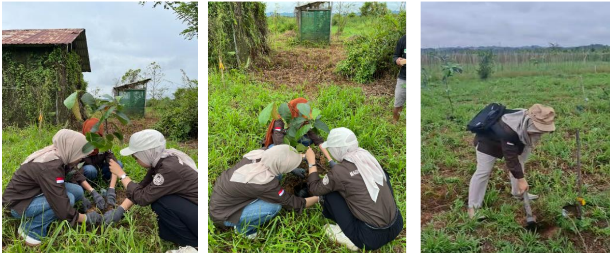
Gambar 6. Kegiatan Penanaman Pohon oleh Peserta

aliran sungai dapat meningkatkan kemampuan tanah untuk menyerap air hujan dan mengurangi risiko erosi. Melalui kegiatan pengabdian Masyarakat dengan penanaman pohon di DAS ini juga dapat membantu meningkatkan standar hidup masyarakat sekitar Karang Mumus, Samarinda dengan menyediakan air bersih dan meningkatkan produktivitas pertanian, sehingga dapat meningkatkan kesejahteraan ekonomi bagi Masyarakat (Yudha et al., 2024).