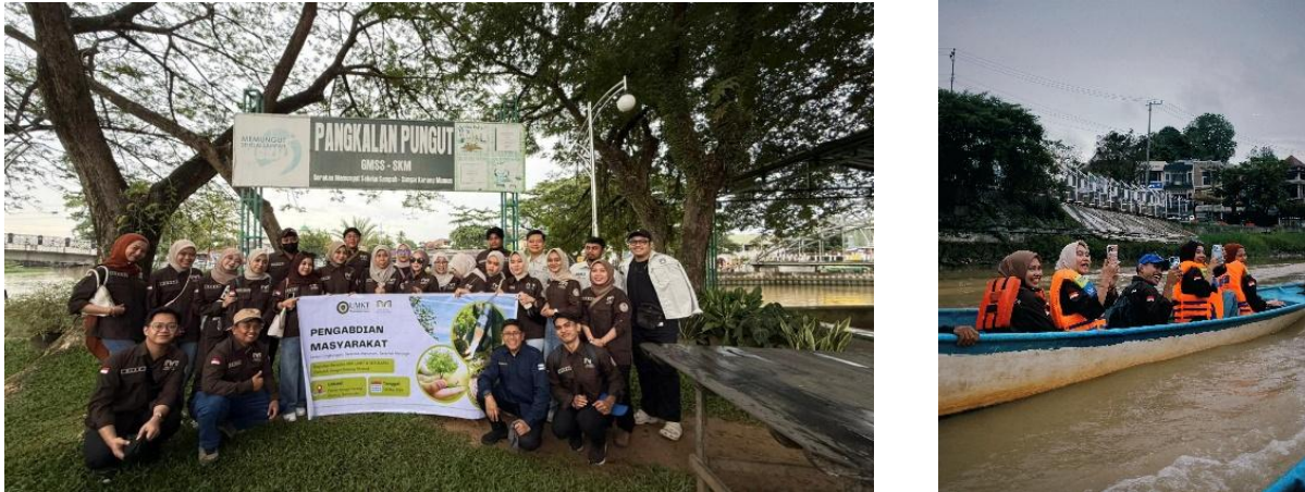
Gambar 2. Kegiatan Edukasi Susur Sungai

Kegiatan susur sungai dilaksanakan di sepanjang daerah aliran Sungai Karang Mumus yang bergerak dari titik awal di Pangkalan Pungut, (Kecamatan Samarinda Kota) menuju Sekolah Sungai (Kecamatan Samarinda Utara).