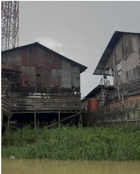
Gambar 5. Potret Salah Satu Peternakan Ayam di DAS Karang Mumus

Pada gambar 4 dan 5 merupakan salah satu tantangan dalam pengelolaan daerah aliran sungai Karang Mumus. Penelitian yang dilakukan oleh (Alifah et al., 2024) menunjukkan bahwa limbah cair dari pabrik tahu mengandung senyawa organik tinggi yang menyebabkan penurunan kualitas air sungai serta meningkatkan risiko penyakit kulit dan gangguan pencernaan.