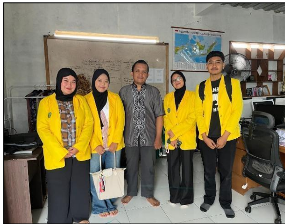
Gambar 1. Observasi pertama

Tahap selanjutnya dilakukan dengan menyusun strategi, metode pembelajaran, materi, serta instrumen evaluasi yang sesuai dengan hasil identifikasi kebutuhan. Metode yang diterapkan yaitu Contextual Teaching and Learning (CTL) , Cooperative Learning , dan Problem Based Learning (PBL) yang diintegrasikan dalam strategi Collaborative Contextual Problem-Based Learning (CCPBL) . Strategi tersebut diharapkan dapat menciptakan suasana pembelajaran yang lebih interaktif dan mendorong keterlibatan aktif warga belajar selama proses pembelajaran berlangsung.