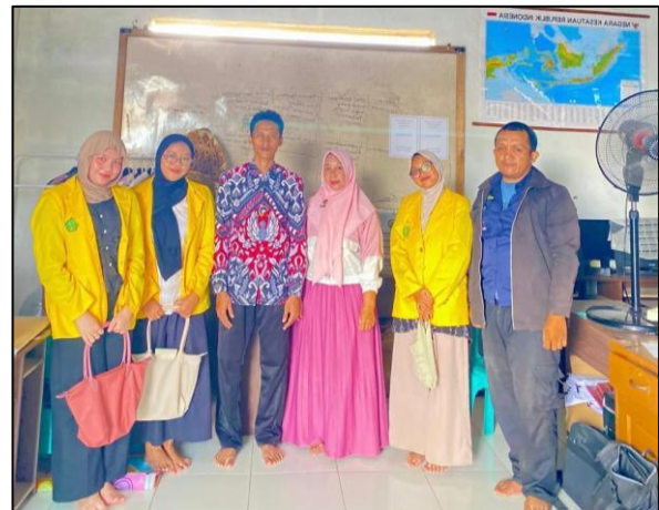
Gambar 2. Observasi kedua

Perangkat pembelajaran dan instrumen evaluasi yang telah disusun kemudian diuji validitasnya bersama tutor PKBM, dosen pengampu mata kuliah, dan mahasiswa PLP. Uji validitas merupakan suatu uji yang digunakan untuk menguji ketepatan suatu alat ukur dalam mengukur sesuatu yang seharusnya diukur (Rosita et al., 2021). Hasil uji validitas menunjukkan bahwa perangkat pembelajaran dan instrumen evaluasi dinyatakan layak digunakan pada tahap pelaksanaan kegiatan.