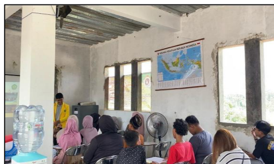
Gambar 5. Pematerian