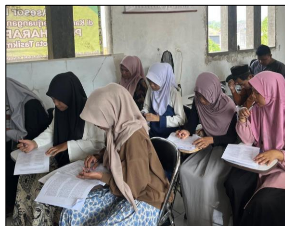
Gambar 7. Pelaksanaan pre-test