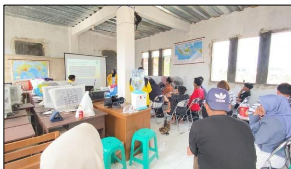
Gambar 4. Pematerian

Tahap evaluasi dilakukan melalui refleksi pembelajaran di akhir kegiatan. Berdasarkan hasil refleksi, beberapa warga belajar menyampaikan bahwa pembelajaran membuat mereka lebih memahami pentingnya menjaga dan melestarikan budaya tradisional di tengah perkembangan budaya modern.