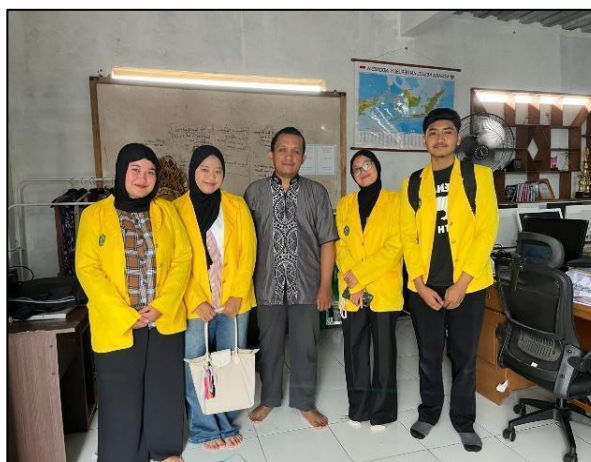
Gambar 1. Observasi pertama

Tahap selanjutnya dilakukan dengan menyusun strategi, metode pembelajaran, materi, serta instrumen evaluasi yang sesuai dengan hasil identifikasi kebutuhan. Metode yang diterapkan yaitu Contextual Teaching and Learning (CTL) , Cooperative Learning , dan Problem Based Learning (PBL) yang diintegrasikan dalam strategi Collaborative Contextual Problem-Based Learning (CCPBL) . Strategi tersebut diharapkan dapat menciptakan suasana pembelajaran yang lebih interaktif dan mendorong keterlibatan aktif warga belajar selama proses pembelajaran berlangsung.