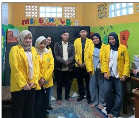
Gambar 3. Uji Validitas bersama tutor PKBM