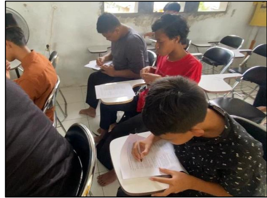
Gambar 9. Pelaksanaan post-test

Berdasarkan hasil pre-test dan post-test , sebagian besar warga belajar mengalami peningkatan nilai setelah mengikuti pembelajaran menggunakan strategi CCPBL . Peningkatan yang cukup signifikan terlihat pada beberapa warga belajar, beberapa peserta yang sebelumnya telah memperoleh nilai tinggi mampu mempertahankan hasil belajarnya setelah kegiatan berlangsung.