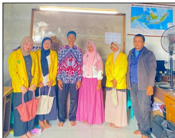
Gambar 2. Observasi kedua

Perangkat pembelajaran dan instrumen evaluasi yang telah disusun kemudian diuji validitasnya bersama tutor PKBM, dosen pengampu mata kuliah, dan mahasiswa PLP. Uji validitas merupakan suatu uji yang digunakan untuk menguji ketepatan suatu alat ukur dalam mengukur sesuatu yang seharusnya diukur (Rosita et al., 2021). Hasil uji validitas menunjukkan bahwa perangkat pembelajaran dan instrumen evaluasi dinyatakan layak digunakan pada tahap pelaksanaan kegiatan.