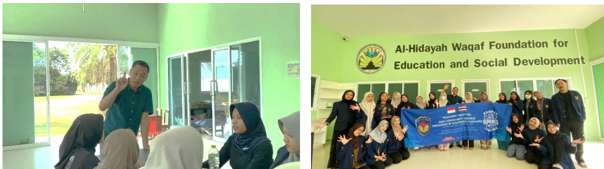
Gambar 2. Pelaksanaan Pemberian Materi Konseptual untuk Guru-guru di Tailan

Kegiatan pelatihan diawali dengan pemberian materi tentang karakteristik peserta didik masa kini, khususnya generasi Z dan generasi Alpha yang sangat dekat dengan teknologi digital. Dalam sesi ini dijelaskan bahwa keterlibatan teknologi dalam pembelajaran dapat meningkatkan motivasi, perhatian, dan partisipasi siswa. Selanjutnya, peserta diberikan materi tentang konsep menjadi guru yang adaptif terhadap perkembangan zaman, dengan fokus pada becoming an engaging and enjoyable teacher, designing practical learning activities and teaching creatively, utilizing technology in teaching and learning, dan effectively making use of available facilities . Materi ini bertujuan untuk membangun mindset guru agar tidak hanya sebagai penyampai materi, tetapi juga sebagai fasilitator pembelajaran yang kreatif dan inovatif. Pelaksanaan penyampaian materi konseptual dapat dilihat pada Gambar 2.