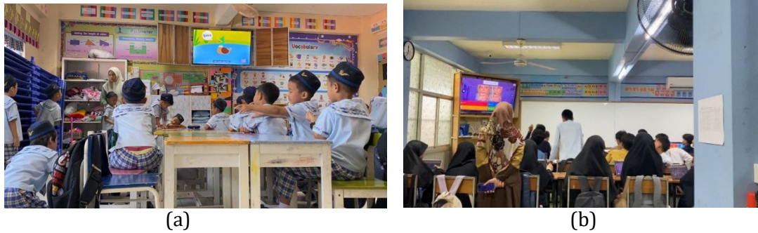
Gambar 5. Implementasi Pembelajaran Memanfaatkan (a) Video dan (b) Platform Digital di Satit Phatnawitya Yala School

Jika dibandingkan antar sekolah, implementasi teknologi di Muslimeen Suksa School cenderung lebih beragam pada aspek praktik pembelajaran dan visualisasi konsep, terutama melalui penggunaan komputer dan iPad. Sementara itu, di Sorsemsasana Vittaya School, teknologi lebih banyak dimanfaatkan untuk meningkatkan komunikasi pembelajaran dan motivasi siswa melalui penggunaan Smart TV, microphone, dan media interaktif sederhana. Adapun di Satit Phatnawitya Yala School, integrasi teknologi telah berkembang pada penggunaan platform digital dan evaluasi pembelajaran berbasis kuis interaktif. Perbedaan tersebut menunjukkan bahwa tingkat implementasi teknologi dipengaruhi oleh kesiapan guru, karakteristik mata pelajaran, serta kemampuan sekolah dalam mengoptimalkan fasilitas yang tersedia. Integrasi teknologi pendidikan bergantung pada kesiapan masing-masing guru, yang pada gilirannya dipengaruhi oleh kesiapan sekolah. Kesiapan guru untuk mengintegrasikan teknologi pendidikan didasarkan pada keterampilan dan keyakinan yang dirasakan (Petko et al., 2018).