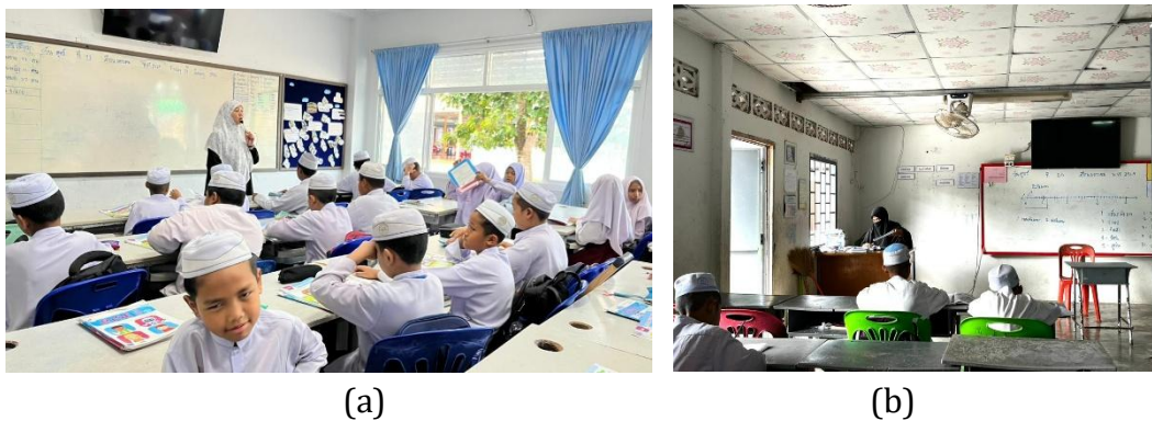
Gambar 1. Kondisi Kelas di (a) Sorsemsasana Vittaya dan (b) Muslimeen Suksa School

Kegiatan pengabdian kepada masyarakat ini dilaksanakan pada sekolah-sekolah di bawah naungan Al Hidayah Foundation yang berlokasi di Hat Yai, Provinsi Songkhla, Thailand Selatan. Yayasan ini mengelola beberapa lembaga pendidikan yang berfokus pada peningkatan mutu pendidikan, khususnya bagi masyarakat Muslim di wilayah Thailand Selatan (Amri et al., 2024). Sekolah-sekolah yang menjadi lokasi pengabdian meliputi Hatyai Wittayakarn School, Sorsemsasana Vittaya, Muslimeen Suksa School, Al Hidayah Islamic Modern School, dan Satit Phatnawitya Yala School, Hatyaiwittayakarn School. Hasil observasi menunjukkan bahwa hampir seluruh ruang kelas di sekolah-sekolah tersebut telah dilengkapi dengan fasilitas pendukung pembelajaran berbasis teknologi, seperti Smart TV, koneksi internet, akses listrik yang memadai dengan banyak stopkontak, serta sistem audio. Kondisi ini menunjukkan bahwa secara sarana dan prasarana, sekolah-sekolah tersebut memiliki potensi besar untuk mengembangkan pembelajaran berbasis teknologi. Kondisi fasilitas di kelas yang mendukung pemanfaatan teknologi dalam pembelajaran dapat dilihat pada Gambar 1.