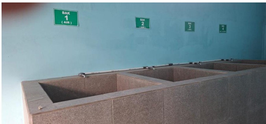
Gambar 4 Bak pembilasan dan disinfeksi plastik plabot infus

Fasilitas pengolahan limbah yang dibangun berupa bangunan tertutup namun dengan ventilasi baik yang terletak di dekat area IPAL, sehingga air bekas pembilasan dan diinfeksi dapat disalurkan ke sistem pengelolaan limbah cair yang telah ada. Di dalam fasilitas tersebut terdapat empat bak pengolahan yang disusun secara berderet, masing-masing berukuran 1 m × 1 m × 0,7 m (Gambar 4). Tiga bak digunakan untuk proses pembilasan dengan air, sedangkan satu bak digunakan untuk proses perendaman dalam larutan klorin. Konfigurasi ini dirancang untuk mendukung alur proses yang sistematis dan meminimalkan kontaminasi silang antar tahap.