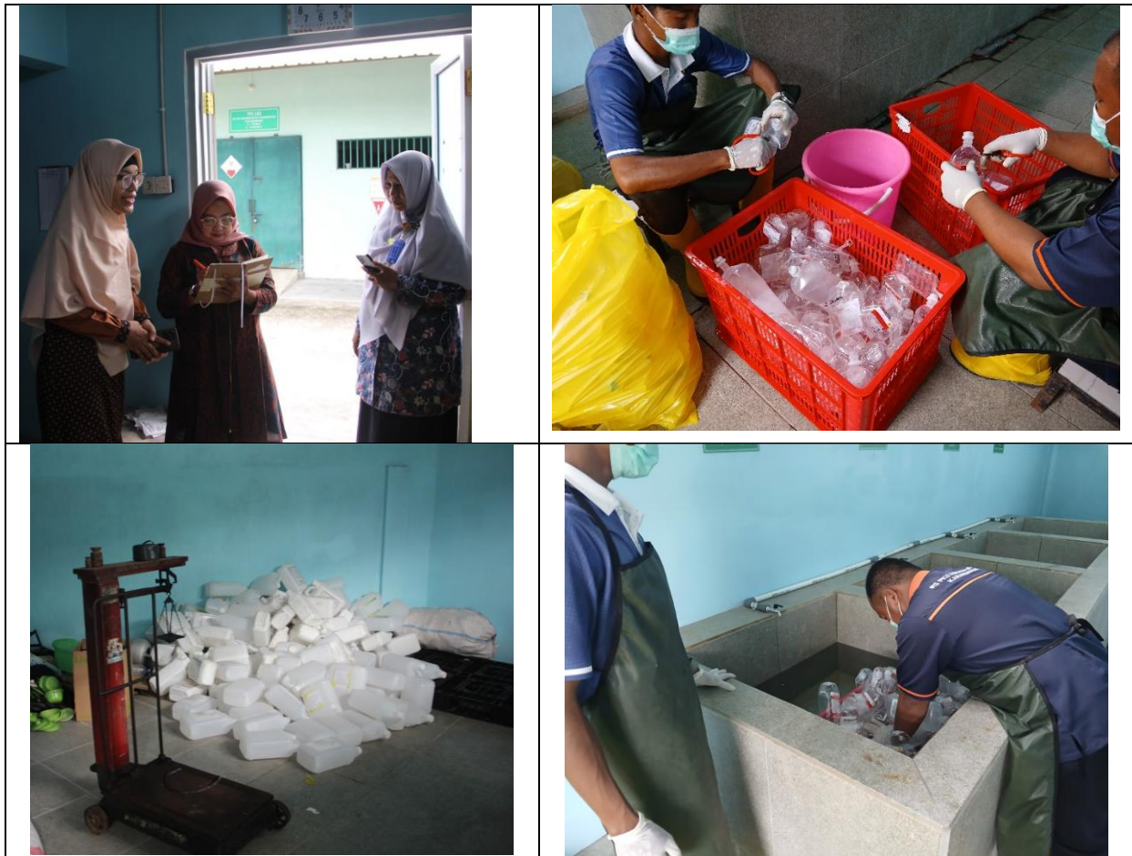
Gambar 5 Dokumentasi pelatihan dan pengarahan tenaga tetap dan tenaga lepas di unit pengolahan limbah