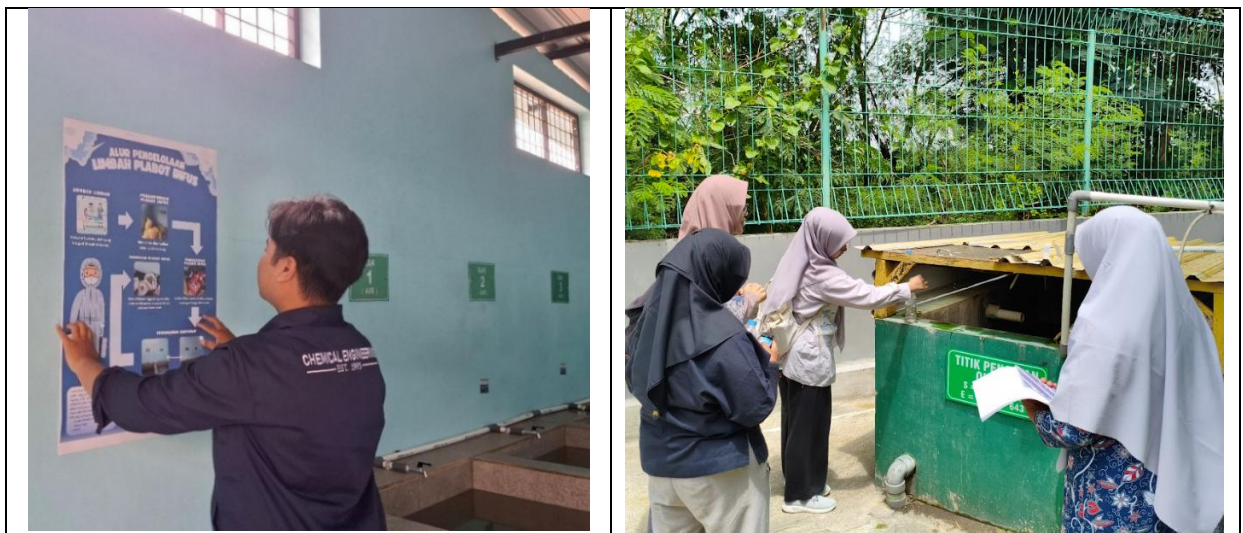
Gambar 6 Dokumentasi penyerahan poster panduan operasi dan pengujian sampel air limbah setelah ada buangan bak disinfeksi

Meskipun sistem telah berjalan dengan baik, hasil uji coba juga menunjukkan adanya beberapa aspek yang masih perlu disempurnakan. Hasil uji coba menunjukkan bahwa beberapa aspek operasional memerlukan penyempurnaan, terutama pengelolaan air sisa disinfeksi yang mengandung residu klorin, konsistensi waktu perendaman, urutan proses pemotongan limbah, serta efektivitas saringan pada bak penampung. Permasalahan pengelolaan air sisa disinfeksi