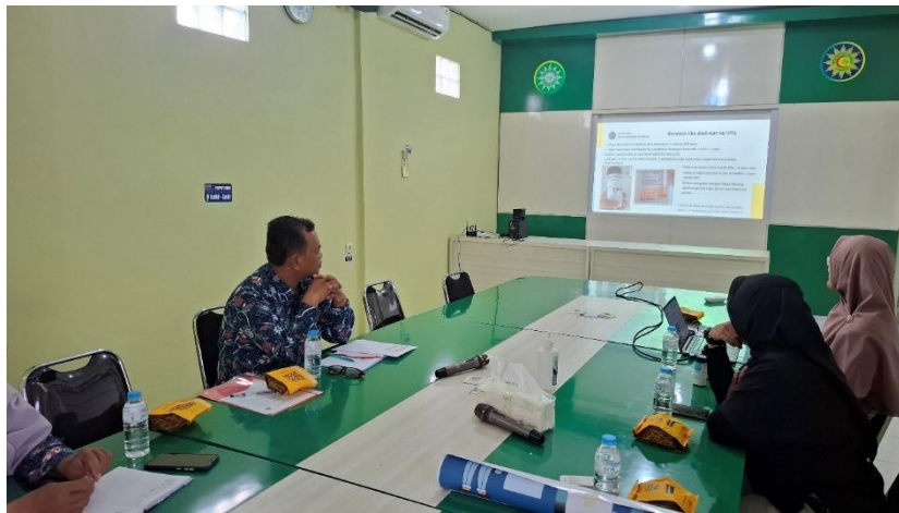
Gambar 5 FGD bersama karyawan unit pengolahan limbah dan kepala bagian sarana prasarana untuk evaluasi

Temuan tersebut dibahas dalam Focus Group Discussion (FGD) antara tim pengabdian dan mitra. Hasil FGD kemudian ditindaklanjuti dengan penyempurnaan teknis dan operasional. Setelah penyempurnaan sistem, parameter keluaran air limbah dicek dan dipastikan tetap memenuhi baku mutu sesuai regulasi (Peraturan Menteri Lingkungan Hidup Dan Kehutanan Republik Indonesia Nomor: P.68/Menlhk-Setjen/2016 Tentang Baku Mutu Air Limbah Domestik, 2016). Dengan ini perbaikan tidak berhenti pada tahap identifikasi masalah, tetapi telah diterapkan dalam sistem yang berjalan.