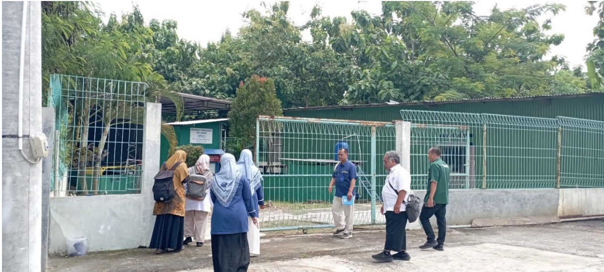
Gambar 3 Tim pengabdian melakukan peninjauan calon lokasi tempat pengolahan limbah plastik dan melakukan wawancara terhadap karyawan rumah sakit

Uji coba operasional dilakukan selama dua bulan dengan simulasi pengoperasian mandiri oleh mitra. Pada tahap ini dilakukan pemantauan terhadap kinerja sistem, termasuk kapasitas pengolahan, konsistensi operasional, serta kendala teknis yang muncul. Pada akhir masa ujicoba, tim pengabdian juga melakukan peninjauan dan wawancara langsung di lokasi. Hasil uji coba dan peninjauan kemudian dievaluasi melalui Focus Group Discussion (FGD) untuk merumuskan perbaikan dan penyempurnaan sistem, yang langsung diterapkan setelah FGD.