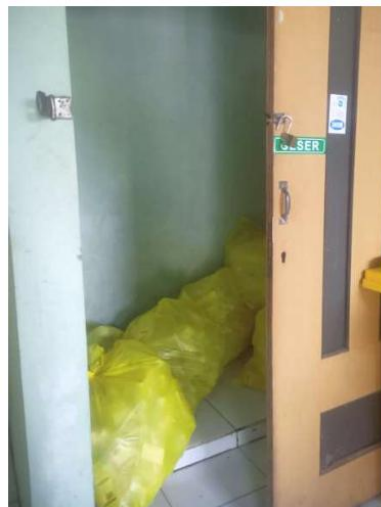
Gambar 1 Limbah plastik plabot infus dikumpulkan sebelum diambil pihak ketiga sebulan sekali sebelum ada sistem pengolahan

Berdasarkan kondisi tersebut, diperlukan suatu sistem pengelolaan limbah plastik non-infeksius yang tidak hanya memenuhi aspek teknis, tetapi juga memastikan kepatuhan terhadap regulasi serta dapat dioperasikan secara berkelanjutan oleh rumah sakit. Oleh karena itu, kegiatan pengabdian masyarakat ini difokuskan pada pendampingan pengelolaan limbah plastik plabot infus melalui penerapan sistem pengolahan internal berbasis pemilahan, pencucian, disinfeksi, dan pengeringan. Tujuan kegiatan ini adalah meningkatkan kapasitas RS PKU Muhammadiyah Karanganyar dalam mengelola limbah plastik plabot infus non-infeksius secara mandiri dan sesuai regulasi.