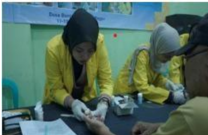
Gambar 1. Skrining Kesehatan di Balai Desa Banjarsari

Skrining kesehatan dilaksanakan pada hari pertama kegiatan, Kamis 11 Desember 2025, bertempat di Balai Desa Banjarsari. Kegiatan skrining ini selaras dengan tahap persiapan yang telah dirancang dalam metode, di mana setiap peserta terlebih dahulu mengisi formulir skrining awal sebelum menjalani pemeriksaan. Gambar 1 menunjukkan suasana pelaksanaan skrining kesehatan di Balai Desa Banjarsari, yang tampak berjalan tertib dan terstruktur dengan antrian peserta yang teratur di setiap meja pemeriksaan (Ramli et al., 2023). Tujuan dari skrining kesehatan adalah mengurangi risiko sakit berat atau bahkan kematian akibat penyakit. Fokus pemeriksaan pada kegiatan ini adalah kadar gula darah sewaktu, asam urat, dan kolesterol.