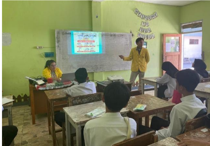
Gambar 3. Penyampaian Materi Penyuluhan Edukasi TBC

di tempat yang sejuk dan gelap, terutama di tempat yang lembab. Disampaikan pula tanda dan gejala TBC yakni batuk dengan dahak yang berlangsung selama 2-3 minggu atau bahkan lebih, yang dapat disertai batuk berdarah mengandung darah (hemoptisis), kesulitan bernapas (dispnea), tubuh merasa lelah (myalgia), hilangnya selera makan (anoreksia), penurunan berat badan, sering berkeringat di malam hari, serta demam berkepanjangan (Siagian, 2021).