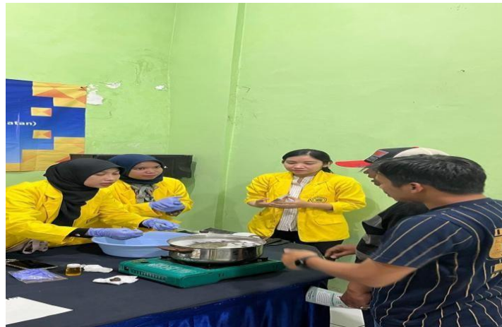
Gambar 6. Pembuatan Sabun Buah Lerak

Formula kedua adalah sabun berbasis buah lerak ( Sapindus rarak ). Buah lerak mengandung saponin, zat alami yang bisa membuat busa dan berfungsi sebagai bahan pembersih. Menggunakan lerak sebagai bahan sabun alami tidak hanya membantu mengurangi ketergantungan pada produk buatan manusia, tetapi juga bisa menjadi cara untuk mengajarkan masyarakat tentang kekayaan alam lokal yang ramah lingkungan. Sabun dari ekstrak lerak memiliki sifat antibakteri dan aman digunakan untuk kulit yang sensitif. Selain itu, sabun lerak juga mampu mengurangi kandungan deterjen dalam air limbah rumah tangga, dan produk sabun lerak bisa dikembangkan dalam skala rumah tangga karena harganya terjangkau dan ramah lingkungan (Mubarq et al., 2025). Cara pembuatannya adalah dengan merendam buah lerak, kemudian merebus buah lerak bersama 280 gram garam hingga mudah dihancurkan. Setelah air lerak dingin, buah lerak diremas sampai hancur dan siap dikemas serta digunakan.