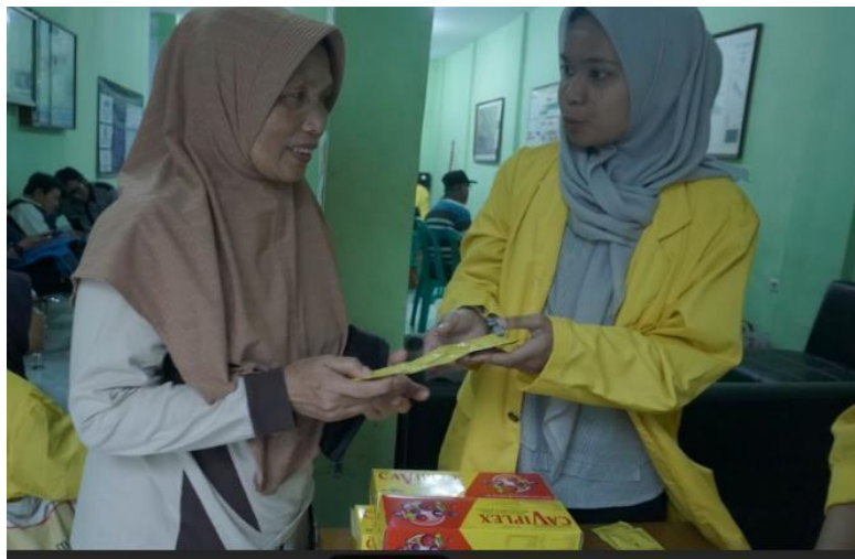
Gambar 2. Pemberian Vitamin

Sementara itu, dalam pemeriksaan gula darah tidak ditemukan peserta yang melebihi batas normal kadar gula darah, di mana kadar gula darah yang melebihi batas normal adalah lebih dari 200 mg/dL. Bahkan ada beberapa warga yang gula darahnya di bawah 100 mg/dL. Hasil gula darah normal pada seluruh peserta merupakan kabar baik, namun perlu dimaknai secara hati-hati mengingat pemeriksaan dilakukan secara sewaktu (GDS) bukan puasa, sehingga tidak dapat sepenuhnya mengesampingkan risiko diabetes. Masyarakat tetap dianjurkan untuk melakukan pemeriksaan gula darah puasa secara berkala di fasilitas layanan kesehatan terdekat (Zaman et al., 2019).