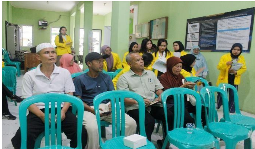
Gambar 4. Penyuluhan Pengetahuan Penyakit Degeneratif dan Demensia

Materi yang disampaikan mencakup penjelasan tentang penyakit degeneratif sebagai penyakit tidak menular yang berlangsung kronis karena kemunduran fungsi organ tubuh akibat proses penuaan. Faktor risiko utama penyebab penyakit degeneratif adalah pola makan yang tidak sehat, kurangnya aktivitas fisik, konsumsi rokok, serta meningkatnya stres. Perubahan gaya hidup dalam hal konsumsi makanan terutama dipicu oleh peningkatan pendapatan ekonomi, kesibukan kerja yang tinggi, dan promosi makanan trendy asal barat, utamanya fast food, tetapi tidak diimbangi dengan pengetahuan dan kesadaran gizi, sehingga budaya makan berubah menjadi tinggi lemak jenuh dan gula, serta rendah serat dan rendah zat gizi mikro (Sarman et al., 2022). Beberapa jenis penyakit degeneratif yang dijelaskan kepada warga meliputi hipertensi yang dikenal sebagai Silent Killer dengan klasifikasi tekanan darah dari normal, pre-hipertensi hingga hipertensi berat; asam urat sebagai hasil akhir metabolisme purin dengan nilai normal laki-laki 3,5-7 mg/dL dan perempuan 2,6-6 mg/dL; serta diabetes mellitus yang terjadi karena tubuh tidak memiliki cukup hormon insulin (Zaman et al., 2019).