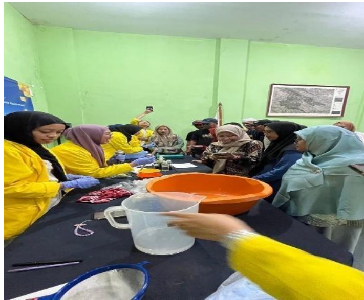
Gambar 5. Pembuatan Sabun Ekstrak Daun Pandan dan Sari Jeruk Nipis

Workshop pembuatan sabun herbal dilaksanakan pada tanggal 12 Desember 2025 di Desa Banjarsari, Kecamatan Ciawi, Kabupaten Bogor, melibatkan warga dan ibu-ibu PKK. Workshop ini dilaksanakan secara demonstratif sesuai tahapan pelaksanaan dalam metode, di mana seluruh peserta dapat langsung mempraktikkan kedua formula sabun herbal (Setiawan et al., 2025). Workshop ini bertujuan untuk meningkatkan kesadaran lingkungan serta memberikan keahlian praktis dan kemampuan berpikir kreatif kepada warga, sekaligus menjadi sarana pembelajaran berbasis praktik yang ramah lingkungan.