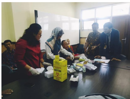
Gambar 3. Dokumentasi Pada Saat Tes Gula Darah Dan Kolesterol