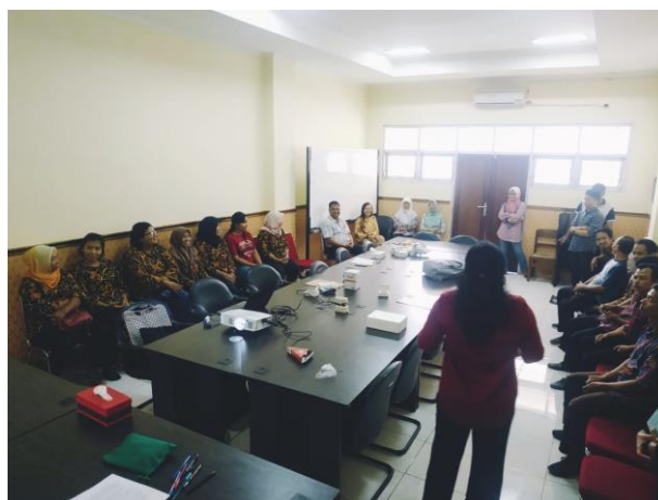
Gambar 2. Tim Pengabdian Memberikan Penjelasan Tentang Dosis Latihan dan Ketentuan-Ketentuan Yang Akan Dilaksanakan

Hasil pengukuran kadar gula darah sebelum dan sesudah program menunjukkan adanya perubahan yang positif, di mana sebagian besar peserta mengalami penurunan kadar gula darah yang signifikan. Sebelum program dimulai, rata-rata kadar gula darah peserta berada di atas ambang batas normal, dengan beberapa peserta bahkan memiliki kadar gula darah yang sangat tinggi (lebih dari 245 mg/dL). Setelah enam minggu menjalani aktivitas naik turun tangga secara