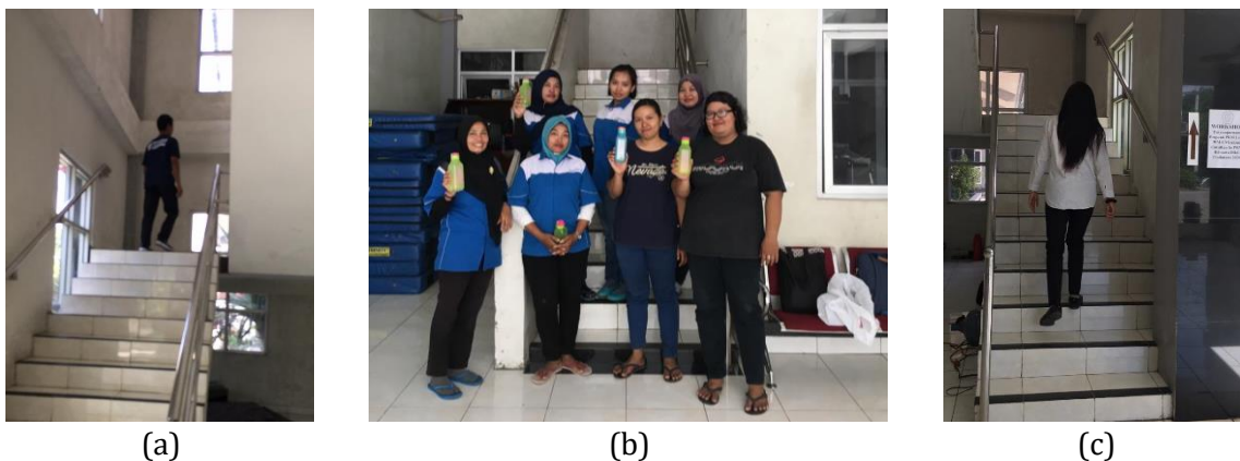
Gambar 4. Pendampingan Aktifitas Fisik (a) karyawan Laki-laki (b) sesi istirahat (c) Karyawan Perempuan

Respon peserta terhadap program ini sangat positif. Selain penurunan kadar gula darah dan normalnya kadar kolesterol, banyak peserta melaporkan peningkatan energi, kualitas tidur yang lebih baik, dan perasaan lebih sehat setelah rutin melakukan aktivitas fisik. Ini mengindikasikan bahwa selain manfaat fisiologis, program ini juga berkontribusi pada peningkatan kesejahteraan umum peserta. Tingkat kehadiran dan partisipasi peserta dalam aktivitas fisik harian sangat tinggi, dengan lebih dari 80% peserta mengikuti program ini secara konsisten selama enam minggu penuh. Hal ini menunjukkan efektivitas pendekatan pendampingan dalam memotivasi peserta untuk terlibat aktif dalam program ini.