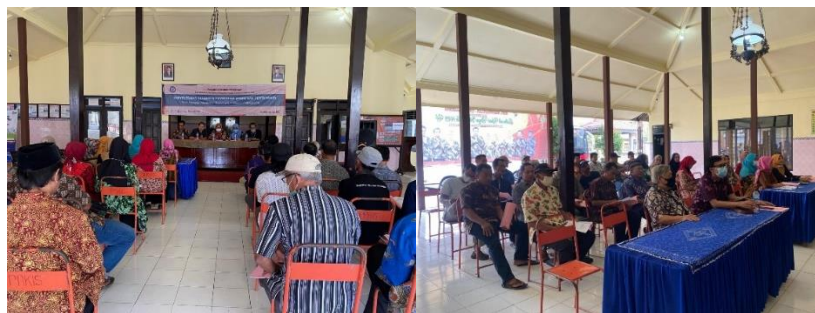
Gambar 2. Dokumentasi Kegiatan Pendampingan

Secara keseluruhan, kegiatan Pengabdian kepada Masyarakat ini memberikan kontribusi nyata dalam meningkatkan literasi hukum masyarakat desa, memperkuat kesadaran hukum, serta mendorong penyelesaian sengketa secara damai dan berkeadilan. Oleh karena itu, kegiatan serupa perlu dilakukan secara berkelanjutan dan diperluas cakupannya, baik dari segi materi maupun jumlah peserta, agar manfaatnya dapat dirasakan secara lebih luas oleh masyarakat. Dengan meningkatnya pemahaman dan kesadaran hukum masyarakat, diharapkan potensi sengketa hukum waris dan pertanahan di Desa Pakisrejo dapat diminimalkan, sehingga tercipta kehidupan masyarakat yang harmonis, tertib hukum, dan berkeadilan.