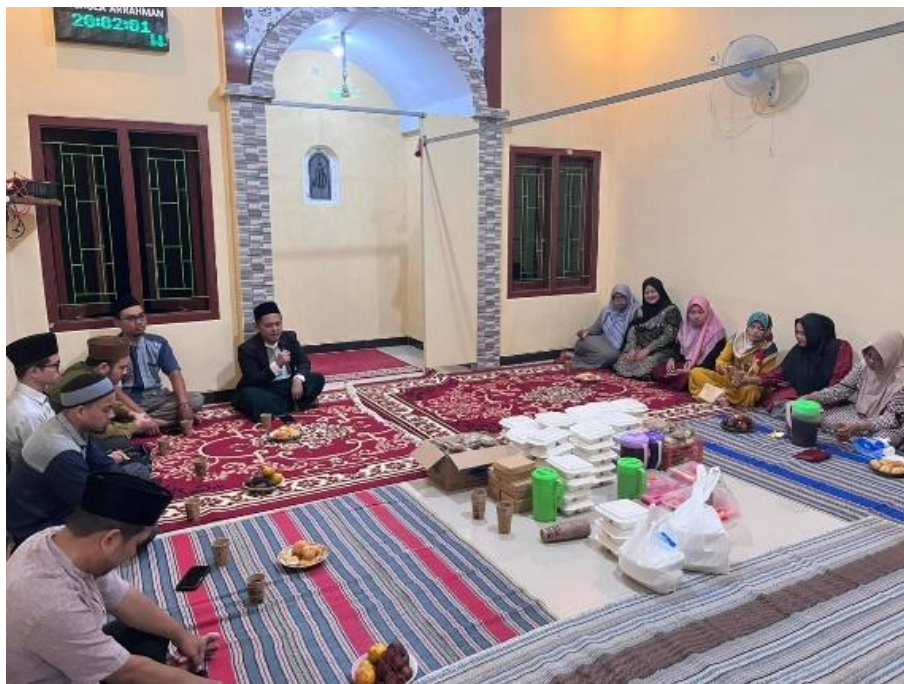
Gambar 4. Kajian dan Sarasehan

Luaran lain yang dihasilkan adalah meningkatnya keterlibatan masyarakat dalam kegiatan keagamaan, yang menunjukkan adanya perubahan perilaku sosial ke arah yang lebih aktif dalam praktik ibadah dan pembelajaran keagamaan.