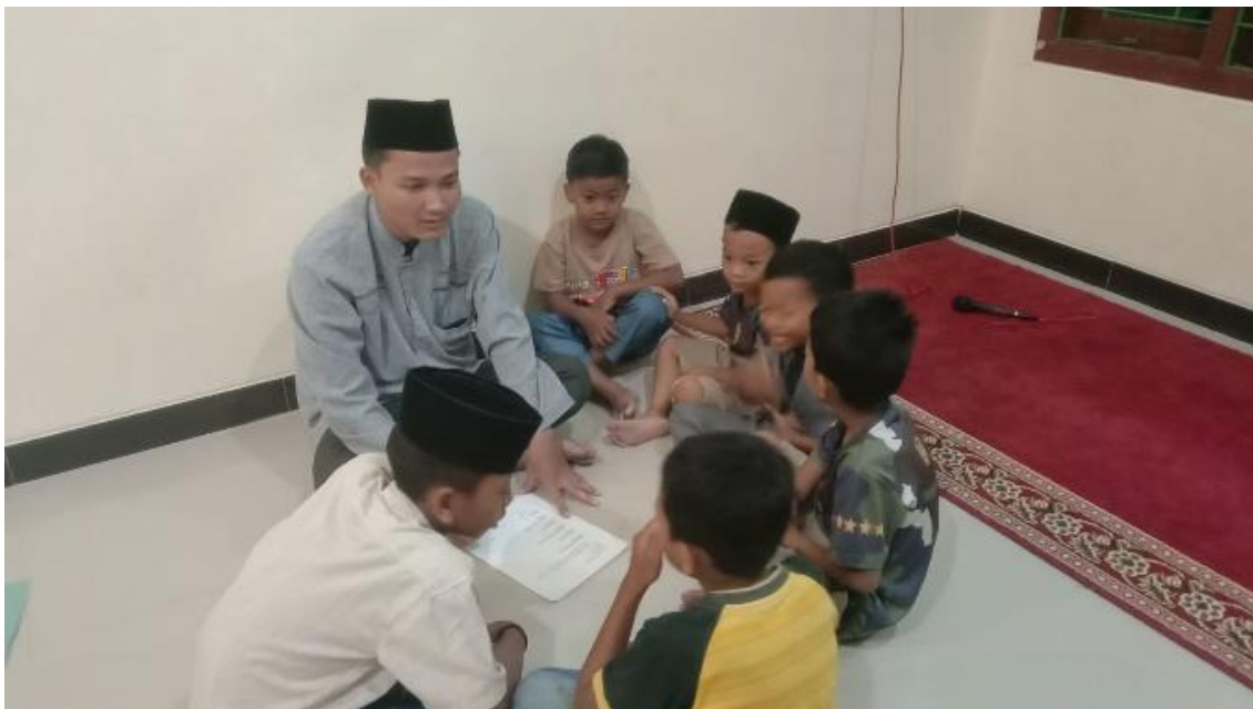
Gambar 2. Pembelajaran Tahsin Al Qur'an

Pelaksanaan pembinaan tahsin al-Qur'an dalam kegiatan ini dilakukan melalui pendekatan pelatihan dan pendampingan langsung yang menekankan pada aspek praktik membaca dan perbaikan kesalahan secara individual. Pendekatan ini mengintegrasikan proses pengenalan tajwid, praktik membaca, serta evaluasi berkelanjutan. (Abd. Basid et al., 2024) Dalam implementasinya, pembelajaran dilakukan secara bertahap sesuai dengan tingkat kemampuan peserta. Peserta dengan tingkat Iqra' awal difokuskan pada pengenalan huruf dan pelafalan dasar, sedangkan peserta pada tingkat Iqra' akhir dan al-Qur'an diarahkan pada peningkatan kelancaran dan ketepatan tajwid. Pola ini menunjukkan bahwa pembelajaran bersifat adaptif terhadap kondisi peserta.