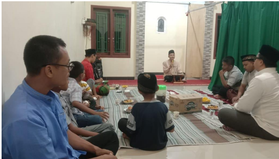
Gambar 5. Kajian Keislaman kepada Masyarakat Setempat