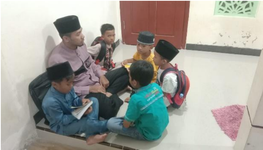
Gambar 3. Pembelajaran Iqra'