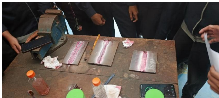
Gambar 4. Tahap Pendampingan Pelaksanaan Pengujian Dye Penetrant Test (DPT)

Selama kegiatan praktik berlangsung, dilakukan pendampingan secara intensif oleh tim pengabdian untuk memastikan setiap peserta mampu mengikuti prosedur dengan benar. Pendampingan ini juga bertujuan untuk meminimalkan kesalahan serta meningkatkan kualitas pembelajaran.