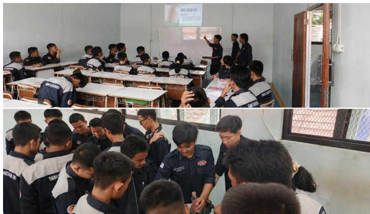
Gambar 2. Pembelajaran teori dan praktik DPT di SMKN 2 Kota Bandung.

Prosedur praktik Dye Penetrant Test (DPT) dilakukan sesuai standar yang mengacu pada ASTM E165/E165M – Standard Practice for Liquid Penetrant Testing (ASTM International, 2018), dengan tahapan sebagai berikut: