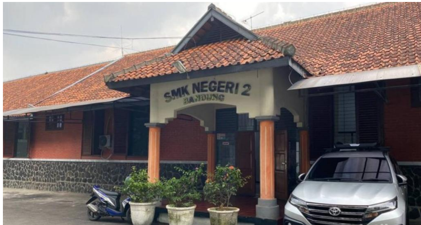
Gambar 1. SMKN 2 Kota Bandung

Dalam konteks pendidikan vokasi, penguasaan kompetensi inspeksi pengelasan menjadi sangat penting untuk meningkatkan kesiapan kerja siswa dalam menghadapi tuntutan industri (UNESCO, 2020). Namun, berbagai studi menunjukkan bahwa masih terdapat kesenjangan antara kompetensi yang dimiliki lulusan dengan kebutuhan industri, terutama dalam aspek keterampilan praktis dan kemampuan aplikasi di lapangan (Gessler & Siemer, 2020; Wibowo & Setiawan, 2019).