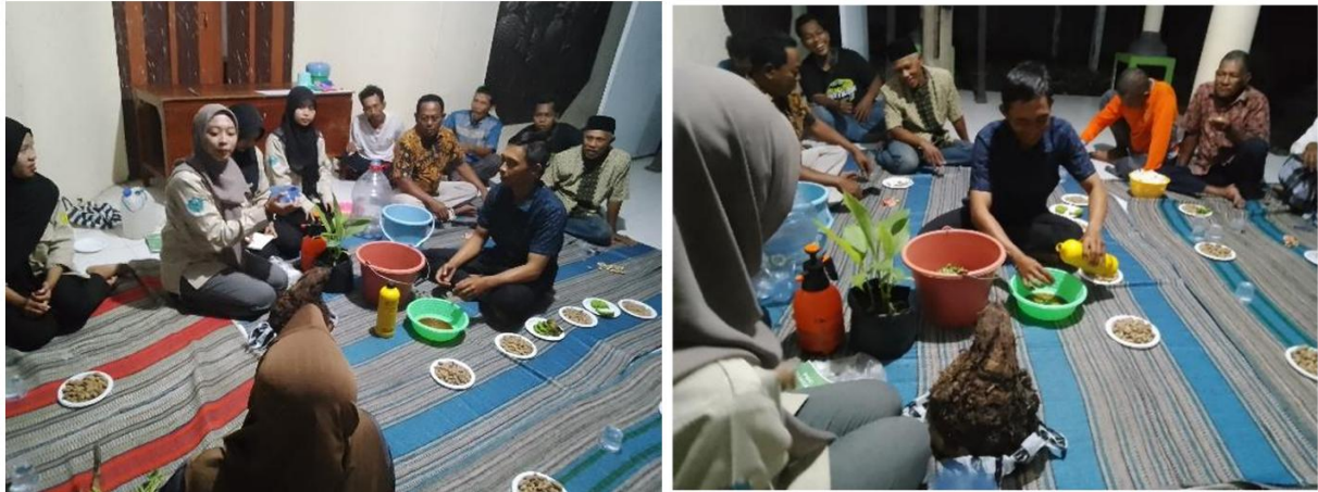
Gambar 3. Demonstrasi Kegiatan Pembuatan Pupuk Organik Cair (POC) Berbahan Dasar Pelepeh Pisang

penerima informasi namun juga terlibat aktif dalam berbagi pengetahuan lokal dan pengalaman yang dimiliki (Fibriani et al., 2026). Interaksi tersebut memperkaya proses pembelajaran, meningkatkan pemahaman peserta, serta memperkuat keterampilan praktis dalam mengolah dan mengaplikasikan POC secara tepat. Dengan demikian, kegiatan pengabdian ini tidak hanya menjadi media transfer ilmu pengetahuan, tetapi juga menjadi ruang kolaboratif yang mendukung peningkatan kapasitas dan pemberdayaan peserta secara berkelanjutan (Kirana et al., 2023).