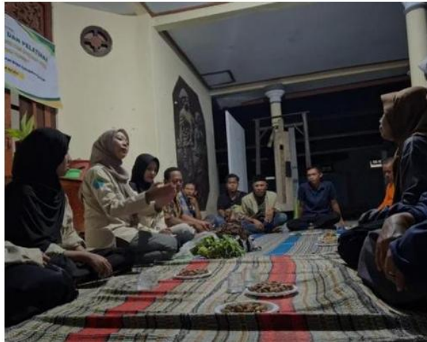
Gambar 2. Pemaparan Materi Pupuk Organik Cair yang Berasa dari Pelepeh Pisang pada Kegiatan Pengabdian Kepada Masyarakat

mengaplikasikan POC secara mandiri. Hal ini sesuai yang dinyatakan oleh (Yusriadin et al., 2024) menyatakan bahwa motivasi berprestasi akan meningkatkan produktivitas hasil yang dicapai dan adanya motivasi lebih mendorong petani untuk lebih komitmen dalam praktik pertanian yang lebih baik. Melalui pengetahuan yang disampaikan diharapkan dapat membuat dan menerapkan aplikasi POC secara berkelanjutan dalam kegiatan budidaya yang dilakukan.