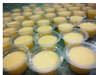
Gambar 6. Dokumentasi Kegiatan Program