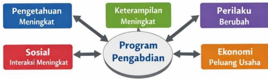
Gambar 5. Dampak Multidimensional Program

Indikator perubahan perilaku terlihat dari meningkatnya kesadaran peserta terhadap pentingnya gizi seimbang. Indikator sosial budaya terlihat dari meningkatnya kerja sama dan interaksi antar peserta. Sementara itu, indikator ekonomi terlihat dari adanya ketertarikan untuk menjadikan puding jagung sebagai produk bernilai jual. Tolak ukur keberhasilan juga didukung oleh tingkat partisipasi peserta yang tinggi dan keterlibatan aktif selama kegiatan.