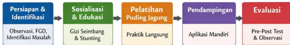
Gambar 1. Tahapan Pelaksanaan Program Pengabdian

Kegiatan identifikasi ini memberikan nilai tambah berupa pemetaan kebutuhan masyarakat yang menjadi dasar dalam penyusunan intervensi yang tepat. Dalam jangka pendek, tahap ini menghasilkan data awal sebagai acuan pelaksanaan kegiatan. Dalam jangka panjang, informasi ini dapat dimanfaatkan oleh masyarakat maupun institusi lokal sebagai dasar perencanaan program lanjutan terkait peningkatan gizi dan pemanfaatan pangan lokal.