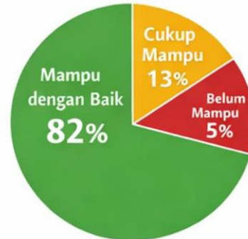
Gambar 3. Grafik Tingkat Keberhasilan Peserta

pendek, peserta memperoleh keterampilan baru, sedangkan dalam jangka panjang berpotensi mengembangkan usaha berbasis pangan lokal. Keunggulan kegiatan ini terletak pada kesederhanaan proses produksi dan kesesuaian dengan kondisi masyarakat. Namun, kelemahannya adalah keterbatasan waktu pelatihan yang belum memungkinkan eksplorasi variasi produk secara lebih luas.