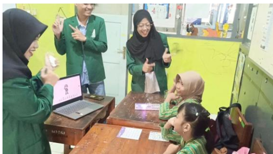
Gambar 3. Keaktifan siswa dalam mengikuti pembelajaran BISINDO

Indikator keberhasilan kegiatan ini ditentukan berdasarkan peningkatan keaktifan siswa selama proses pembelajaran berlangsung. Keaktifan tersebut meliputi perhatian terhadap media visual, keterlibatan dalam praktek BISINDO, serta respon positif terhadap intruksi dan stimulus pembelajaran. Hasil observasi menunjukkan bahwa kedua siswa mengalami peningkatan keaktifan setelah penggunaan media visual, yang mencerminkan meningkatnya motivasi belajar BISINDO. Kelebihan dari kegiatan ini terletak pada kesesuaian media visual dengan karakteristik belajar anak tunarungu, sehingga pembelajaran menjadi lebih menarik dan mudah dipahami. Media visual juga memberikan kesempatan kepada siswa untuk belajar secara aktif dan partisipatif. Adapun kendala yang ditemukan antara lain keterbatasan jumlah subjek kegiatan serta perlunya pengembangan media visual dalam jangka Panjang.