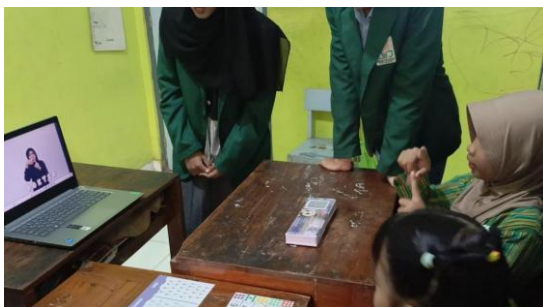
Gambar 1. Proses pembelajaran BISINDO menggunakan media visual

Selama proses pembelajaran berlangsung, siswa didorong untuk mengamati media visual dengan seksama, menirukan gerakan isyarat yang ditampilkan, serta berpartisipasi aktif dalam kegiatan praktik. Media visual berperan sebagai stimulus utama dalam pembelajaran, sehingga siswa tidak hanya menerima informasi secara pasif, tetapi terlibat langsung dalam proses belajar. Selama proses pembelajaran, pendamping berperan aktif dalam mengarahkan, memberikan contoh ulang, serta memastikan setiap siswa dapat mengikuti tahapan pembelajaran dengan baik. Interaksi yang intens antara pendamping dan siswa menciptakan suasana belajar yang suportif dan aman, sehingga siswa merasa lebih percaya diri untuk mencoba dan berpartisipasi. Peran lingkungan sekolah juga turut mendukung keberhasilan kegiatan, terutama dalam penyediaan ruang belajar yang kondusif.