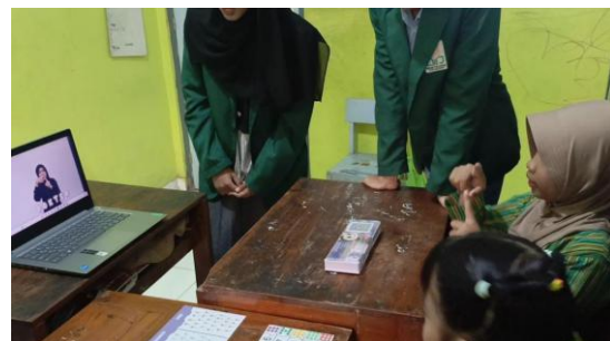
Gambar 4. Respon siswa terhadap penggunaan media visual